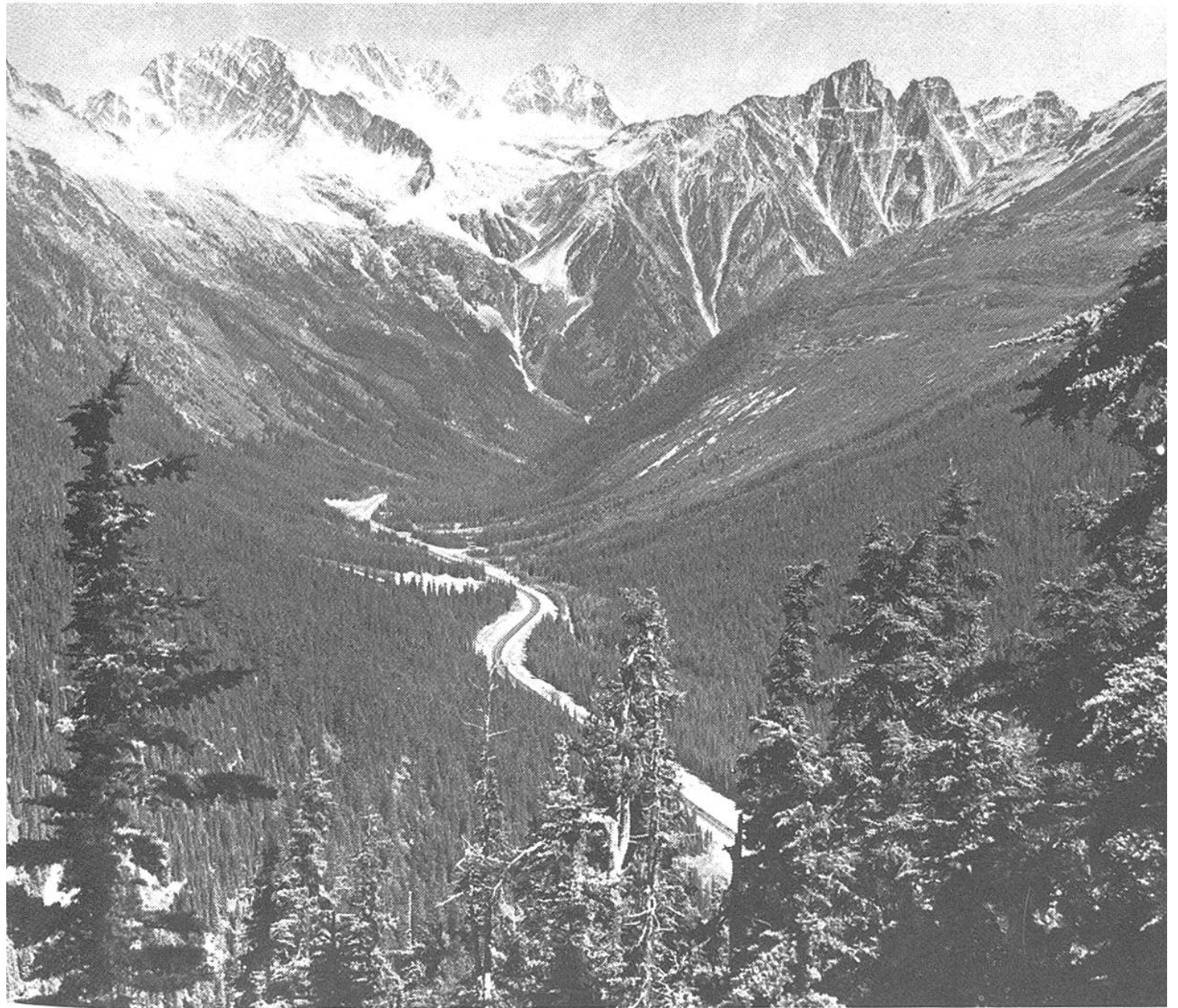
Ein breites Autostrassenband schlängelt sich durch eines der riesigen Waldgebiete Kanadas.

hungrig nach dem dichten, frischen Unterholz, das den Funken die richtige Nahrung gab. Ein ausgedörrtes Blatt vom Vorjahr zischte auf. Ein spindeldürrer Zweiglein knackte. Flinke Eidechsen versuchten sich zu retten. Überall prasselte und loderte es. Über dem noch kleinen Brandherd segelte mit klagendem