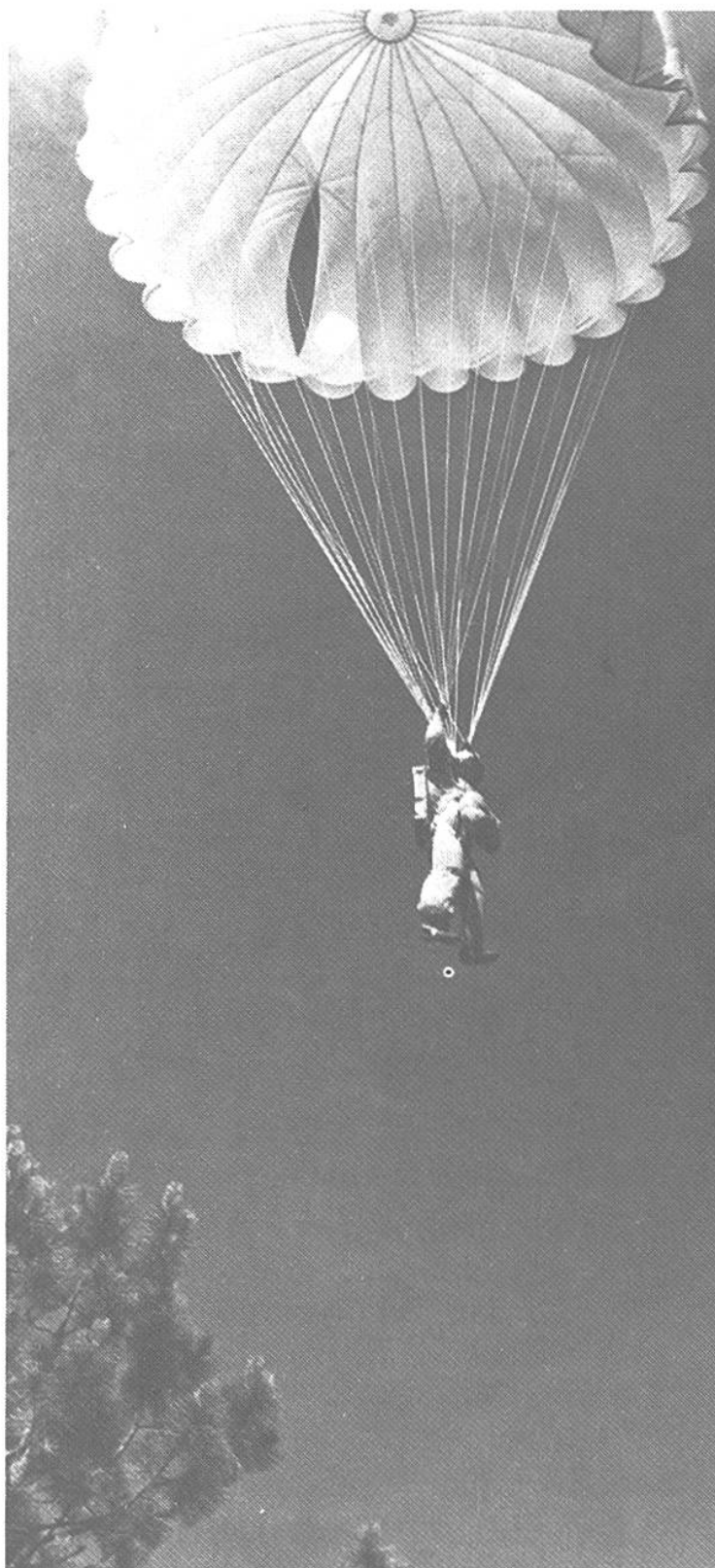
Ein Rauchspringer – «Smokejumper» genannt – bereitet sich zur Landung vor. Der Schlitz im Fallschirm hilft ihm beim Manövrieren und vermeidet so das Hängenbleiben in den Bäumen.

der Wald», schrie er verzweifelt in den Hörer. Der Forstmeister hatte die Waldbrandwehr alarmiert. Die Feuerwand hatte sich in der Zwischenzeit immer tiefer in den Wald gefressen. In der ungeheuren Hitze barsten die uralten Baumriesen. Hochauf stob der Funkenregen und riss die mächtigen Flammen hinter sich her. Da gab's nur noch eine Hilfe: diejenige aus der Luft. Ein Flugzeug mit Fallschirmabspringern war bereits von der Löschstation gestartet. Unterwegs waren die Rauchspringer – «Smokejumpers» genannt –, die mit ihren feuersicheren Asbestanzügen und Helmvisieren unweit des Brandherdes absprangen. Verzweifelt nahmen auch sie den Kampf mit dem Feuerteufel auf. Glücklicherweise lag in der Nähe der breite Rocher River, in dem die örtliche Feuerwehr mittlerweile ihre Pumpen installiert hatte. Unermüdlich dröhnten die starken Dieselmotoren. In zischendem Strahl stürzten sich die Wassermassen aus den Rohren in die unersättliche Glut. Immer rasender tobte der Brand. Die Funkgeräte der Feuerwehrleute liefen heiss. Jetzt wurden auch noch die Spezialhelikopter, die «Helijumpers», angefordert. Im Schutze des Rotors kämpften sich die mutigen Männer mit ihren Löschgeräten und Spezialanzügen zur Feuerfront vor.