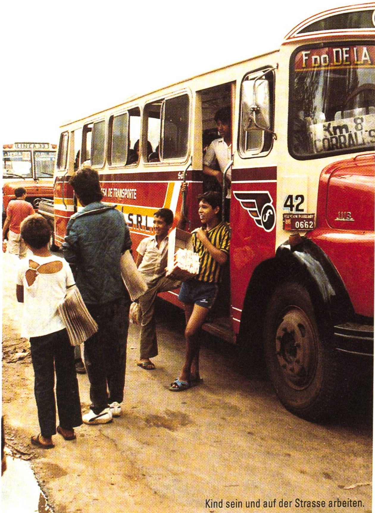
Kind sein und auf der Strasse arbeiten.