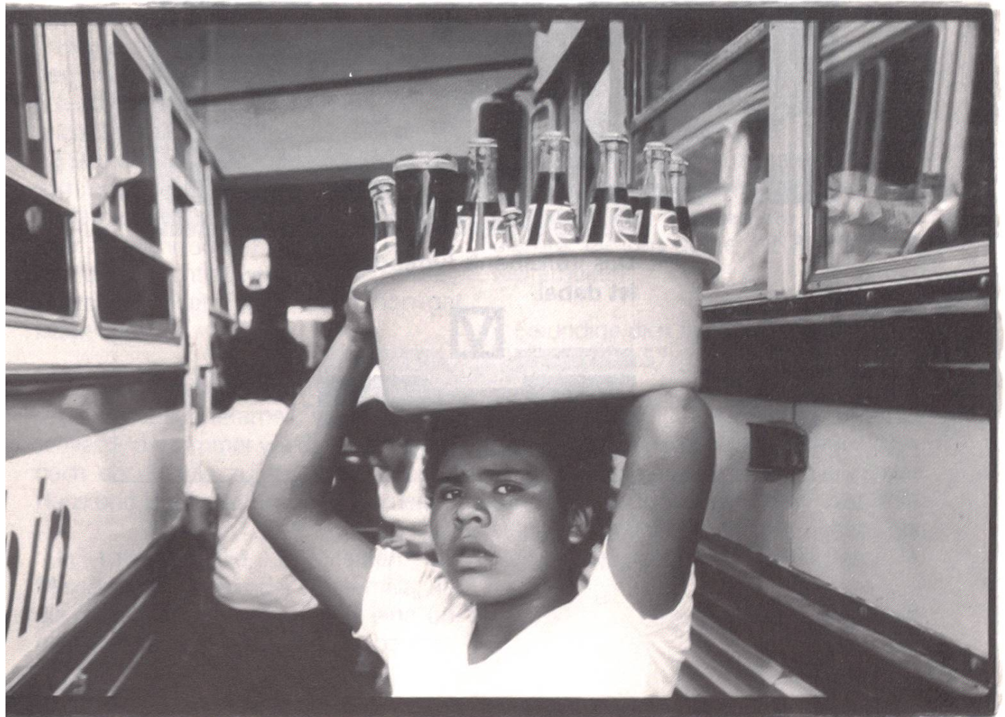
Kinderarbeit in Peru.