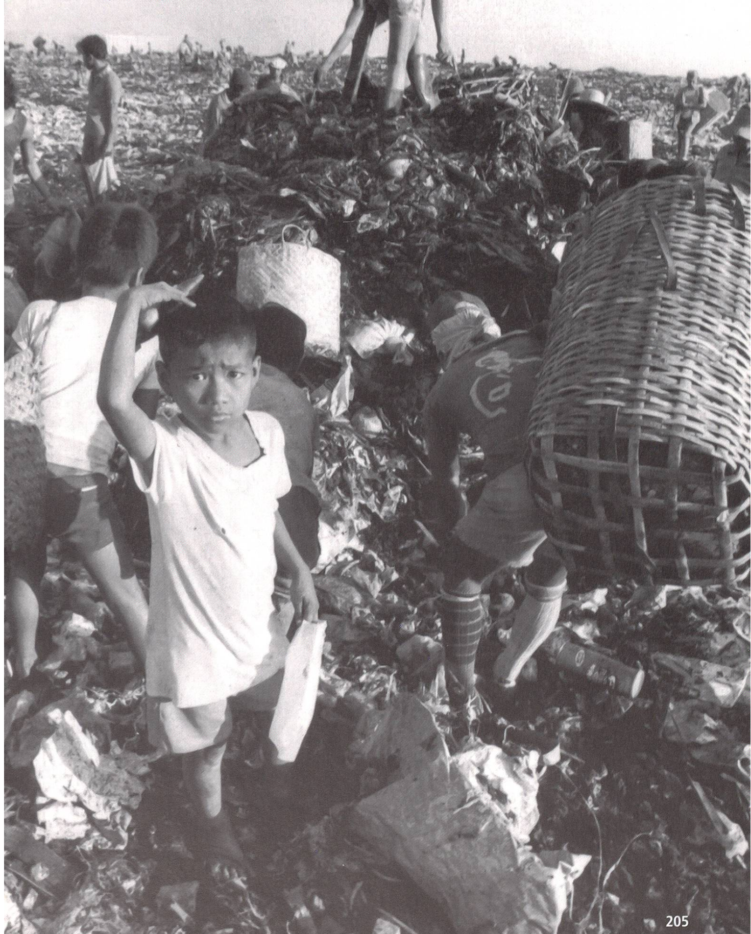
Kinder, die auf den Müllhalden von Manila (Hauptstadt der Philippinen) Altmaterial zur Wiederaufbereitung sammeln, verdienen einen Dollar pro Tag.