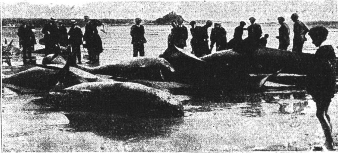
Lebend gestrandete Walfische.