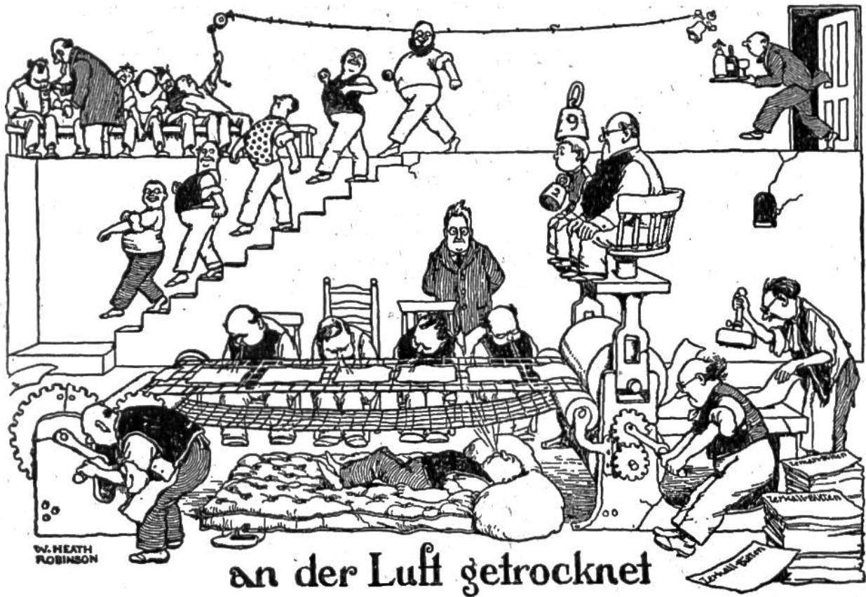
an der Luft getrocknet

das Papier unter dem Kessel, der den Tierleim absondert, vorbeigeführt wird. Auch muss man herzlich lachen, wenn man sieht, wie der Kessel durch Wachskerzen angefeuert wird.