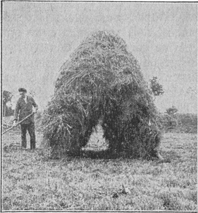
Das Heu wird aufgeladen.