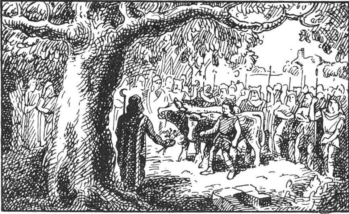
Keltischer Priester schmückt zum Sonnwendfest die Opferstiere mit Mistelzweigen.

sei. Eine Sage erzählt, die Göttin Freia hätte sich von allen Gewächsen versprechen lassen, dem frohen Gotte der Sonne und des Sommers, „Balder“, kein Leid anzutun. Nur die Mistel wurde von Freia vergessen. Das vernahm der listige Loki. Er schnitt aus einem Mistelzweig einen Pfeil. Der Gott des Winters, der blinde Höder, traf damit den lichten Balder tödlich. So musste der Sommer dem Winter weichen.