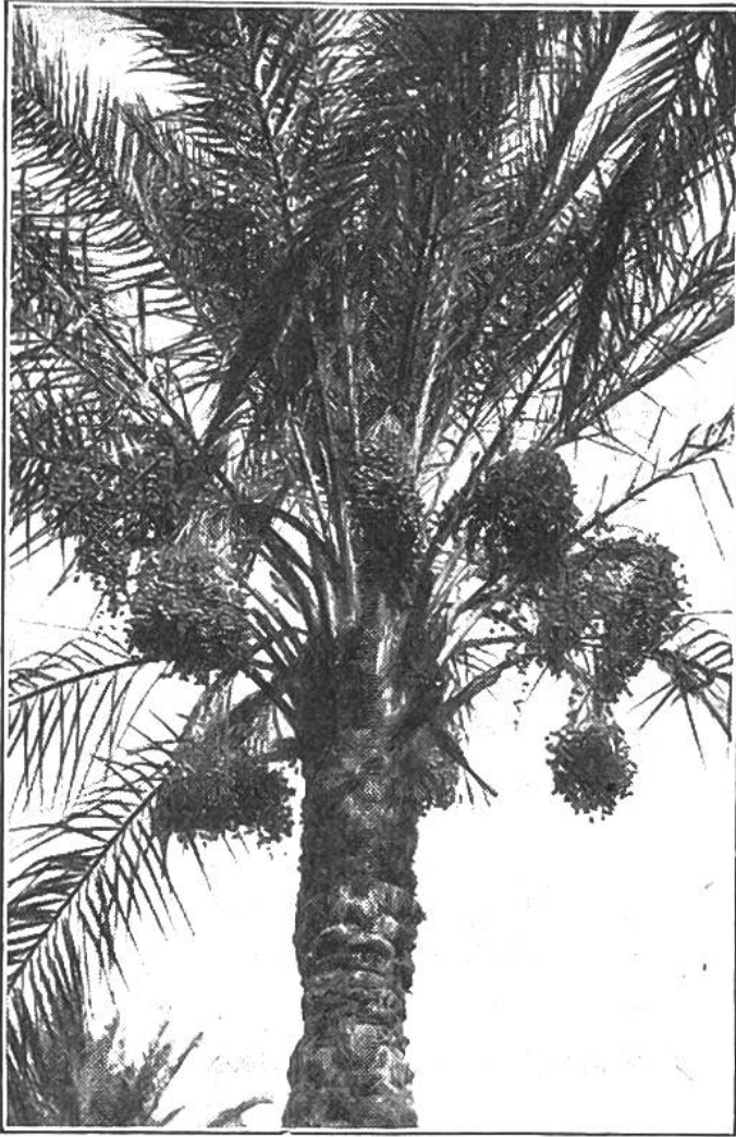
Büschel der zuckersüßen, nahrhaften Datteln in der Krone der hohen Palme.

man übrigens auch in Südeuropa antreffen, aber nur diejenigen von Elche (Spanien), die im Mittelalter von den arabischen Eroberern hergebracht wurden, tragen reife Früchte. Andererseits aber wird in Kriegen, wo ja alles Lebenswichtige zerstört wird, von den Araberstämmen versucht, die Dattelpflanzungen des Gegners zu vernichten, um ihm so sein „tägliches Brot“ zu rauben. Wenn dies gelingt, so ist der Schaden ungeheuer; denn es braucht lange Jahre, bis neue, ertragfähige Dattelpalmen nachgewachsen sind.