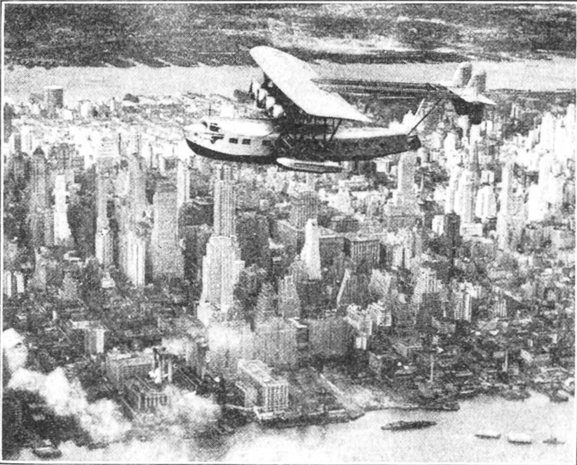
R i e s e n f l u g z e u g über den Wolkenkratzern von Manhattan.

fahrt im Autocar durch das eigentliche New York, durch die Stadtteile Manhattan, Brooklyn, zu einer Bootfahrt nach Staten Island, von wo aus sich die Wolkenkratzer dem Blick in unerhörter Wucht darbieten, zum abendlichen Besuch einer der Kinopaläste. Die riesigen Räume solcher Paläste geben fast mehr noch als die gebotenen Programme einen Begriff, wie sehr alles in diesem Erdteil auf grosse Masse und grosse Zahlen eingestellt ist, sowohl in den weiten Entfernungen im Lande, als auch in den Summen der Erzeugnisse und des Geldes. Die 24 Stunden unseres gedachten Aufenthaltes in der grössten Stadt dürften genügen, um zu zeigen, wie hart für die grosse Zahl der Einwohner das Leben hier ist. Die angestrengte Arbeit wird aber ertragen, weil jeder Amerikaner die Hoffnung nicht aufgibt, einmal „hochzukommen“. Der Arbeitskampf, das geschäftliche Ringen mit den Konkurrenten gleichen den