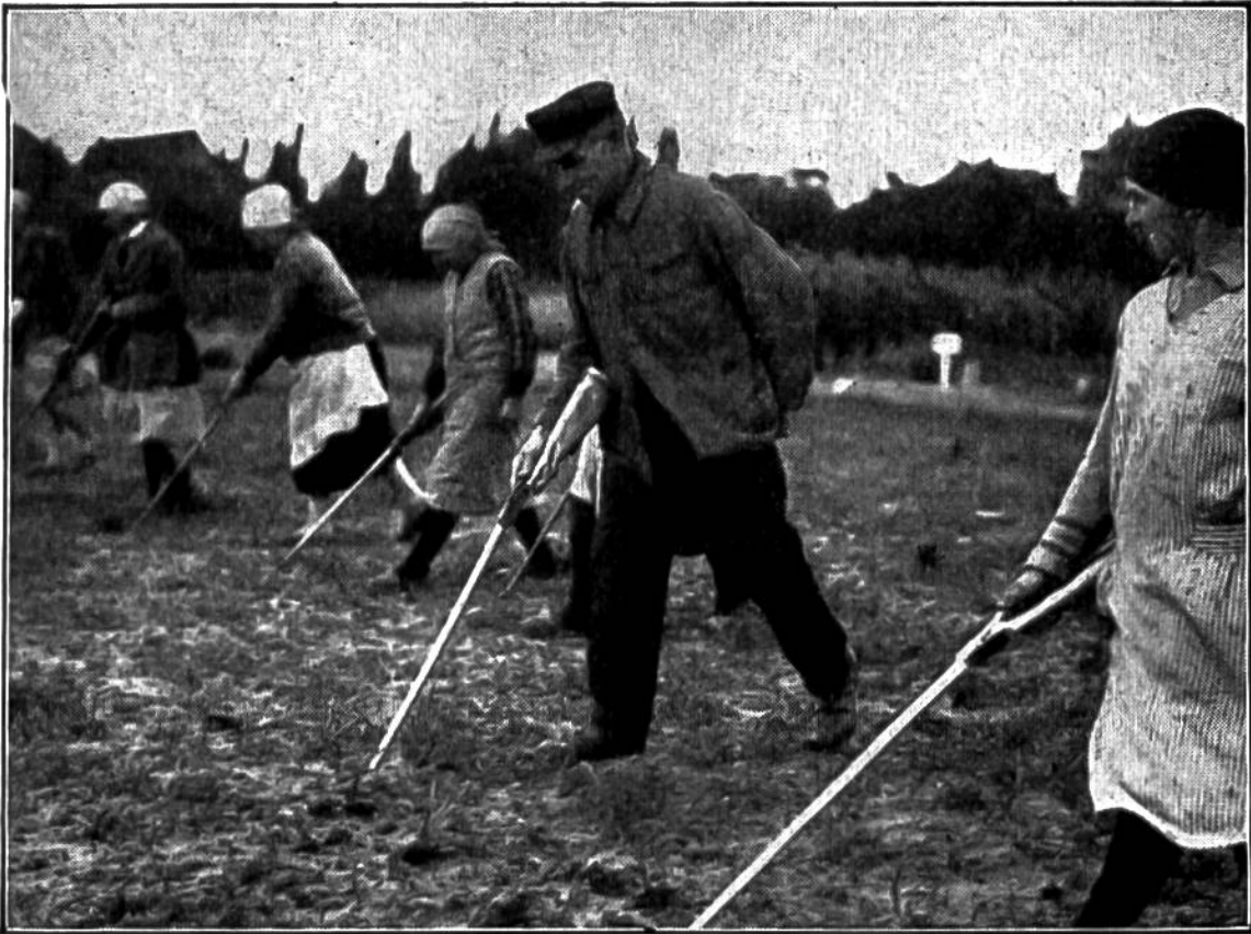
Feldzug gegen die Mäuse. In Schützenlinie geht die Kolonne über das von den Mäusen heimgesuchte Feld. Mit der „Legeflinte“ wird jedes einzelne Mäuseloch mit einigen Körnern Giftgetreide belegt.

Jahr Getreide, oder waren die Raupen des Kohlweisslings ins Kohlfeld geraten, sät man an dieser Stelle im nächsten Jahre Klee.