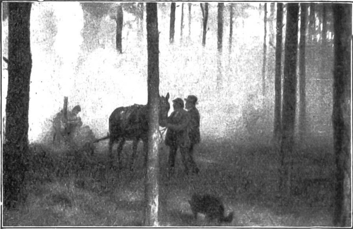
Mit Motorzerstäubern wird der Wald in einen Nebel von Giftstaub gehüllt, der sich auf alle Nadeln und Blätter der Forstbäume als feiner Überzug niederlässt und die fressenden Raupen vernichtet.

und dem Volksvermögen alljährlich ein grosser Schaden. Die Abwehrmassnahmen bestehen aus Vorbeugung und Vertilgung. Vorbeugungsmittel sind zum Beispiel das Anbringen von Leimringen an den Obstbäumen gegen hinaufkletternde Raupen und Ameisen (Ameisen pflegen die schädlichen Blattläuse), oder das Bespritzen der Weinstöcke mit Vitriol.