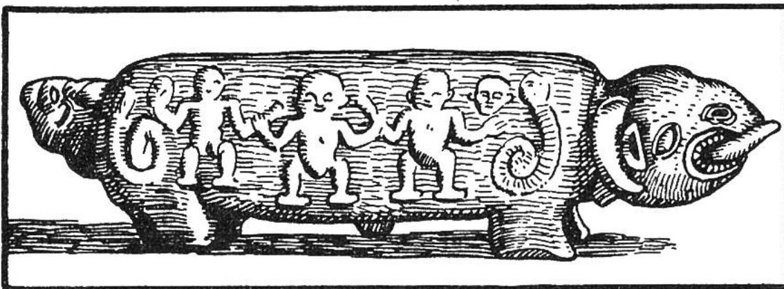
Signaltrommel eines Häuptlings in Kamerun.

In gewöhnlichen Zeiten werden die Nachrichten in der Mundart des betreffenden Gebietes übermittelt. Grosse Ereignisse aber verkünden die Trommeln in einer überall verständlichen „Sprache“, gewissermassen in einem afrikanischen Esperanto. Zur Erlernung der Trommelsprache braucht es unendliche Geduld und sehr viel Zeit. Jedem Stammeshäuptling stehen 1—2 Trommler zur Verfügung, die speziell in dieser Kunst ausgebildet wurden. Besonders die Neger in Kamerun und Togo haben es zu einer erstaunlichen Meisterschaft in dieser Art der Fernmeldung gebracht. Durch die Trommelsprache kann man sich kilometerweit über alles mögliche unterhalten; es werden Geschichten erzählt, Neuigkeiten mitgeteilt, Gesetze bekanntgemacht; man fragt, ruft, höhnt und schimpft vermittelt der Trommel.