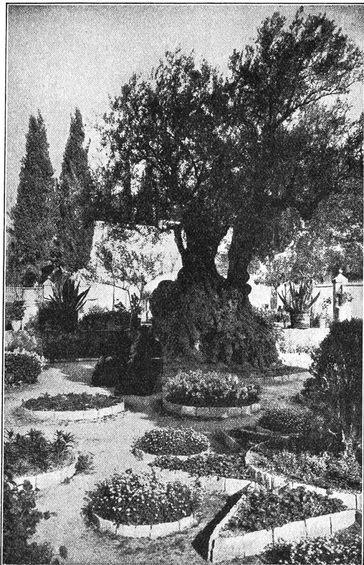
Der Garten Gethsemane, wo Jesus Christus in der Nacht vor seiner Gefangennahme ruhte.