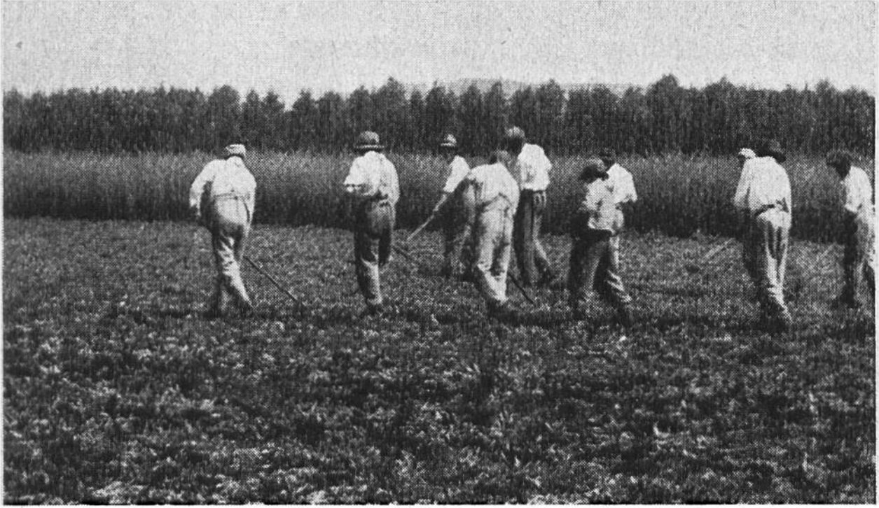
Arbeiten im Zuckerrübenfeld. — Über 2200 Jucharten (797 ha) des „Grossen Moores“ sind jetzt kultiviertes Acker- und Wiesland.

konnte aber erst viele Jahrzehnte später verwirklicht werden.