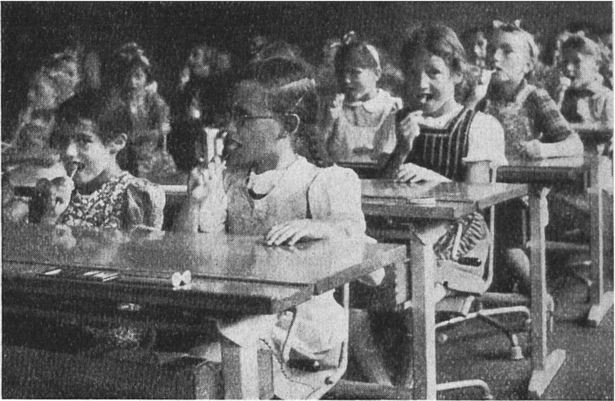
„Zähneputzen“ als Unterrichtsstunde. Trockenübung.

ben, gehen in Gärung über und bilden eine Säure, die den Zahnschmelz an den betreffenden Stellen auflöst. Es entsteht ein Loch. Ohne vielleicht Schmerzen zu verursachen, wird das Loch grösser und tiefer. Der Zahnerv wird angegriffen, geht zu Grunde, und es entsteht dann meist eine Zahnwurzel- und Kieferentzündung. Weitere Folgen: Grosse Schmerzen, Eiterung und Gefahr für den Magen und weiter für den Körper; überdies der Schmerzen wegen schlechtes Kauen, schlechte Ernährung.