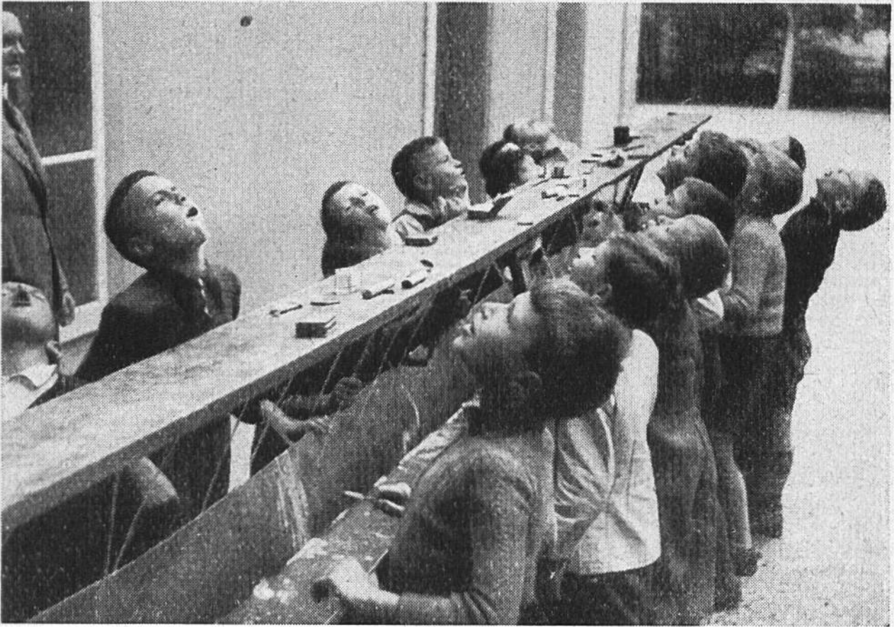
Zahnpflege im Schulhof einer Schweizer Schule.