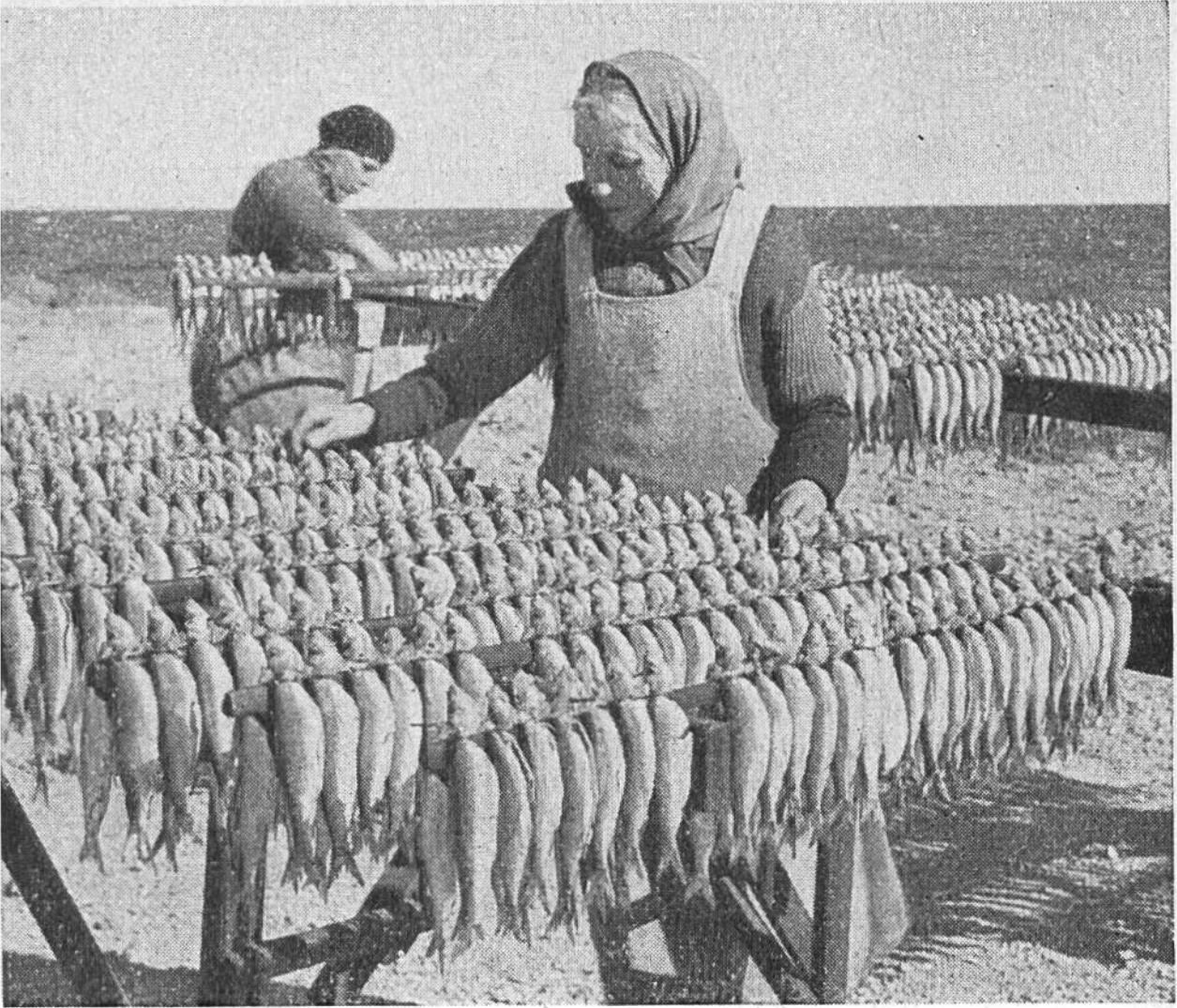
Vor dem Räuchern werden die Heringe auf besonderen Gestellen an der Luft getrocknet.

liche Aufzucht versucht, den wertvollen Speisefisch wieder zu vermehren; aber die grosse Rolle, die er noch zu Ende des letzten Jahrhunderts auf den Fischmärkten von Locarno und Lugano gespielt hat, wird ihm wohl trotz allen Bemühungen nie mehr zukommen. Der eigentliche Hering ist in den Gewässern fast der ganzen nördlichen Halbkugel verbreitet; am bedeutsamsten ist er für die Nordsee, wo sich früher nur die Küstenfischerei mit ihm beschäftigte. Mit der Verbesserung der Seefahrzeuge aber hat sich immer mehr auch der Heringsfang auf der Hochsee entwickelt. Der Hering wird dort mit Schleppnetzen oder auch mit riesigen Treibnetzen gefischt, die durch Schwimmer und Bleigewichte in senkrechter Lage gehalten werden und kilometerlange Schleier bilden. Sie werden dann den in dichten