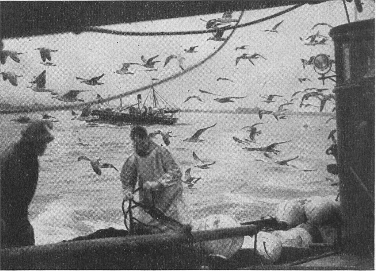
Dampfer einer Heringfang-Flotte, von einem Schwarm Möwen umgeben. Im Vordergrund auf Deck liegen die bojenartigen Netzschwimmer.

besonders günstigen Jahr gegen eine Milliarde kg Heringe gefangen — es handelt sich somit um unvorstellbar grosse Mengen. Diese riesigen Fischmassen beschäftigen nicht nur zahlreiche kleine Fischereibetriebe, sondern auch viele grosse Industrien. Die leicht verderblichen Fische werden auf verschiedene Weise haltbar gemacht und in alle Welt verschickt. Als Konserven, als Rollmops, als Bismarck-, Salz- und Räucherhering gelangen sie auch in den schweizerischen Lebensmittelhandel. Nur wenige Heringe kommen frisch, als sogenannte grüne Heringe zu uns ins Binnenland.