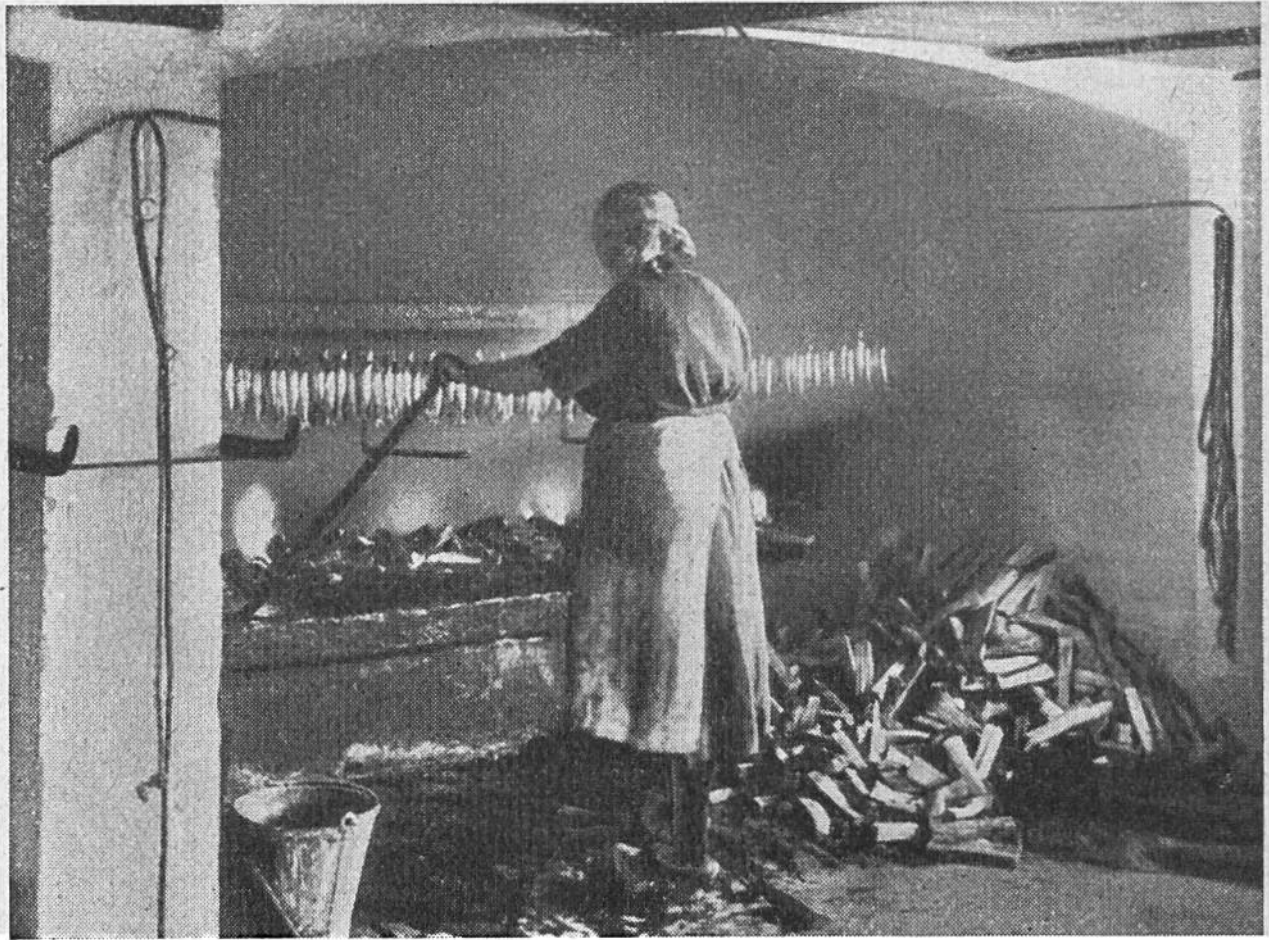
Warmes Räuchern der Heringe auf der Insel Bornholm.

Grosse Mengen erreichen dieses Höchstalter nicht, sondern werden vorher die Beute von Raubtieren oder gelangen auf die Tafel des Menschen. Vielfach erscheinen sie dort als Räucher-Hering. Dieser ist nicht entgrätet, sondern wird mehr oder weniger stark gesalzen und auf besonderen Gestellen zunächst zum Trocknen der Luft und nachher dem Rauch ausgesetzt. Dabei wird zwischen kaltem und warmem Räuchern unterschieden. Beim kalten Verfahren, wie es z. B. beim Lachshering zur Anwendung kommt, werden die stark durchgesalzenen Heringe während mehrerer Tage dem Rauch eines Holzfeuers ausgesetzt. Unter warmem Räuchern dagegen ist ein Verfahren zu verstehen, bei dem die nur schwach gesalzenen Fische kurze Zeit in den heissen Rauch gehängt werden. So wird z. B. der Bückling geräuchert; er ist weniger lang haltbar als etwa der nach dem kalten Räucherverfahren behandelte Lachshering.