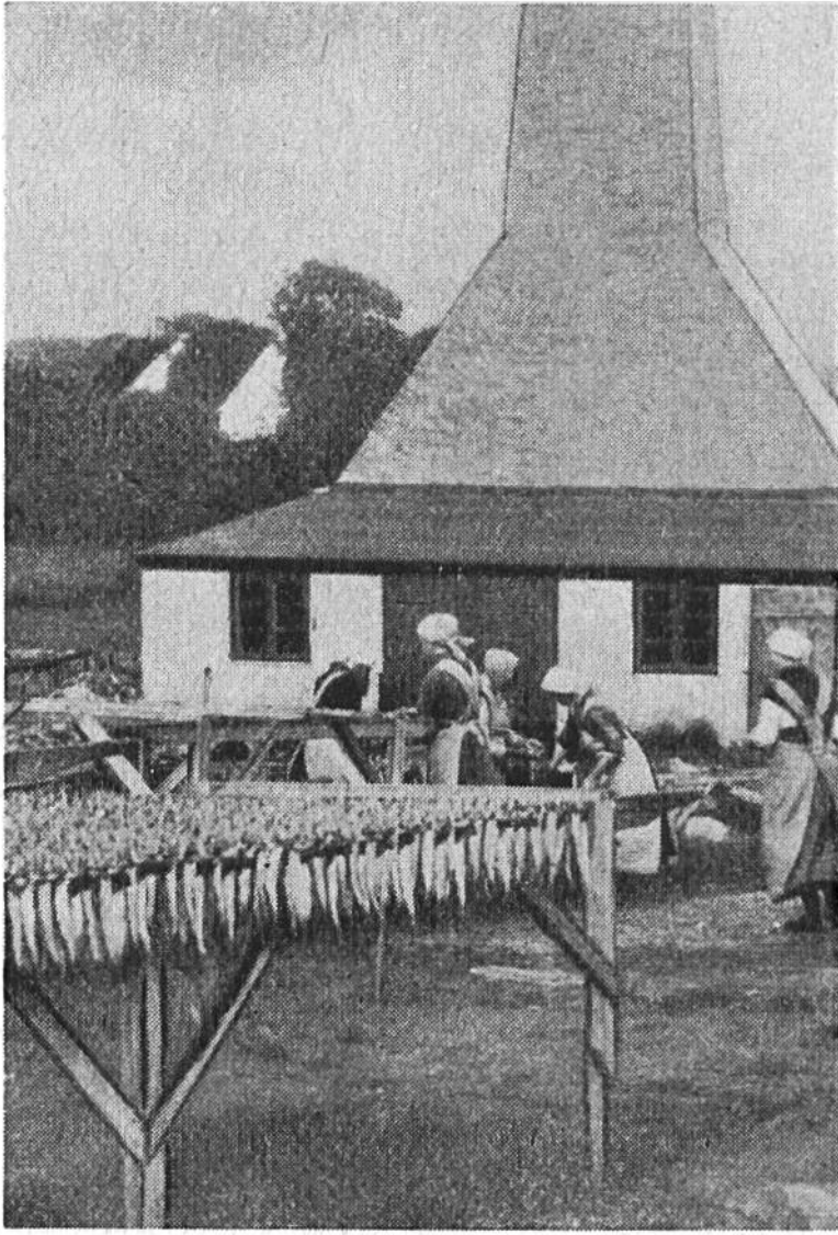
Räucherofen eines kleinen Fischerdorfes auf Bornholm. Im Vordergrund die zum Trocknen aufgehängten Heringe.

Schwärmen ziehenden Heringen sozusagen in den Weg gelegt, so dass sich diese in den feinen Maschen verstricken und darin hängen bleiben. — Bei der Küstenfischerei wird oft so vorgegangen, dass ein Heringschwarm mit Netzen eingekreist und so weit gegen die Küste gedrängt wird, dass die tiefreichenden Netze schliesslich den Boden berühren. Die Fische werden also fast wie Schafe in einer Hürde zusammengepfercht; der Ring aus Netzen wird immer enger gezogen, und end-