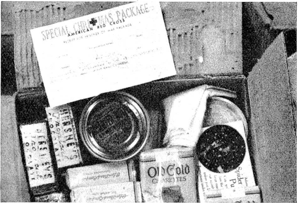
Jeder Kriegsgefangene amerikanischer Nationalität erhielt zu Weihnachten 1943 ein solches Liebesgabenpaket.

bol der friedlichen Schweiz! Sind die Liebesgaben endlich in unserem Land eingetroffen, so erfolgt von hier aus der Versand nach den Bestimmungsorten. Um den Wünschen der Kriegsgefangenenlager regelmässig entsprechen und beim Stocken der ausländischen Zufuhren die Lieferungen aufrechterhalten zu können, werden in den Zollfreilagern von Genf, Vernier, Basel, Vallorbe, Biel, Aarau und Zürich die Liebesgaben, welche der Abteilung für Hilfsaktion des Roten Kreuzes anvertraut sind, aufgestapelt. Der Inhalt von über 5000 Eisenbahnwagen zu 10 t, also ca. 50000 t sind in diesen Lagern bereitgestellt; täglich werden ca. 30 Eisenbahnwagen benötigt, um die Ein- und Ausgänge der Lagerbestände zu transportieren. — Welche Freude bedeutet es für die Gefangenen, wenn sie Bücher in der eigenen Sprache erhalten oder Konservenbüchsen mit einem Lieblingsgericht, das es eben nur zu Hause gibt, entgegennehmen dürfen. Hunderttausende von Kriegsgefangenen empfangen so in ihrer traurigen und schicksalsschweren Lage durch die Vermittlung des Roten Kreuzes ein Zeichen aus der fernen Heimat.