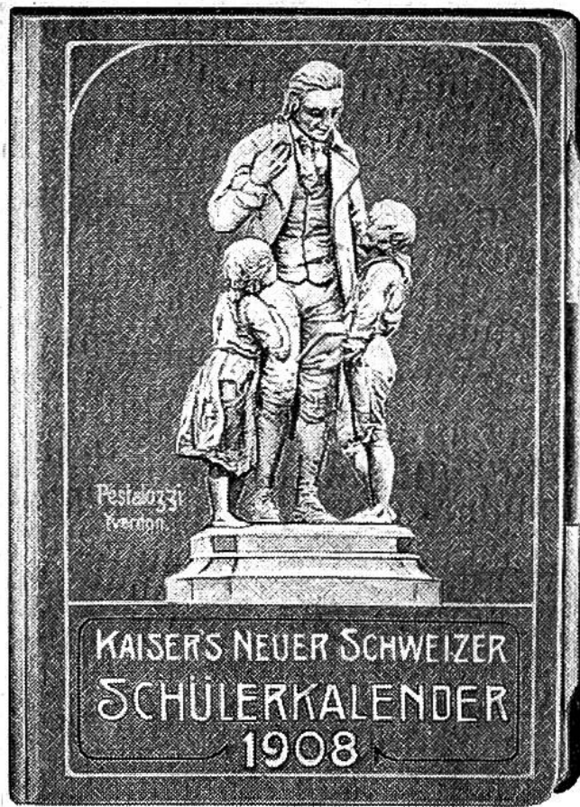
Der Pestalozzi-Kalender ist erstmals für das Jahr 1908 erschienen.

ich als Knabe an ein paar Weihnachtsbüchern erlebt, und es empörte mich, dass sie andern vorenthalten oder vergällt werden sollte. Nach langem Hin und Her sagte mein Vater: „So schreib doch selbst einen bessern Kalender, wenn du's zu können glaubst. Du wirst dann die Schwierigkeiten schon erfahren.“ Da es mir mit meinem Unwillen bitter ernst war, machte ich mich an die Arbeit. Eine Stunde vorher hätte ich noch über die Idee gelacht, dass ich als junger Kaufmann, dem der fernste Weltteil näher lag als dies, ein Buch für die Schweizer Schulkinder schreiben sollte. Doch jede Arbeit, die man mit Ernst und Eifer anpackt, wird interessant. So hat mich dieses Werk nicht mehr losgelassen und mehr auf der Scholle zurückgehalten als alles andere.“