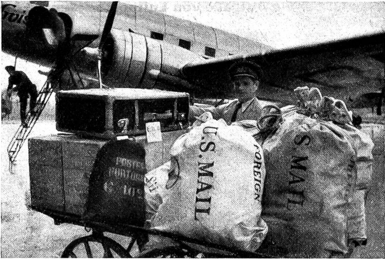
Ausladen von Postsäcken und Stückgütern aus einem „Swissair“-Verkehrsflugzeug.

tative ist unsere Postverwaltung diesem Grundsatz bis auf den heutigen Tag treu geblieben. Sie hat unserer Luftfahrt unschätzbare Dienste erwiesen und schuf ihr eines der soliden Fundamente, auf denen sich unsere Aviatik kräftig entwickeln konnte. ... Mit schönen Marken und interessanten Stempeln wurden Hunderttausende von Markensammlern für die Sache der Luftfahrt angeregt und im Laufe der Jahre als Anhänger gewonnen. Millionen von Franken hat die Post der finanziell stets bedrängten Aviatik zugeführt. Einige der fliegerischen Grosstaten des Landes, insbesondere die Auslandsflüge von Walter Mittelholzer, die „Landflüge“ der Swissair usw. waren ausschliesslich durch die Flugpost ermöglicht worden, dazu noch viele bedeutende Flugveranstaltungen. Auch die nationale Stiftung „Pro Aero“ wäre ohne die Post nie zu ihrer heutigen Bedeutung und segensreichen Aktivität herangewachsen. Der Luftverkehr ist ohne Luftpost und der daraus entfließenden Geldmittel undenkbar. Die Post hat unsere Aviatik grossgezogen.“