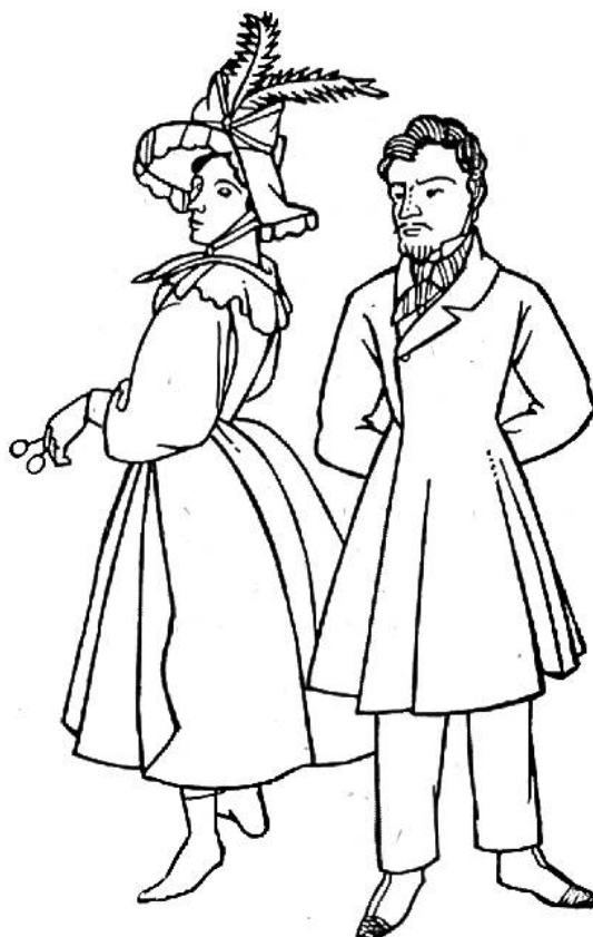
Mode von 1832.