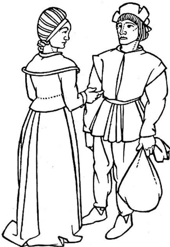
Kleidung der Bürgersleute zur Reformationszeit, nach 1500.