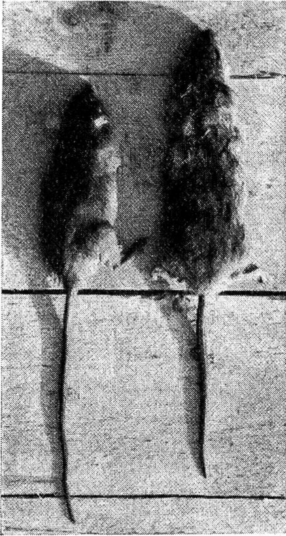
Links: Hausratte, rechts: Wanderratte.

hinsichtlich ihrer Lebensweise ganz verschieden. Die Wanderratte wird gelegentlich auch als Wasserratte bezeichnet; nicht ganz zu Unrecht, denn sie bevorzugt in der Tat die Umgebung von Kanälen, Abzugsgräben, Wasserschächten usw. Sie schwimmt und taucht vorzüglich. An Kehrichtablagerungsstellen, Mistgruben, in der Nähe von Ställen, Schlachthöfen usw. ist die Wanderratte recht häufig; wenn sie in Wohnhäuser eindringt, hält sie sich immer an die Kellerräume.