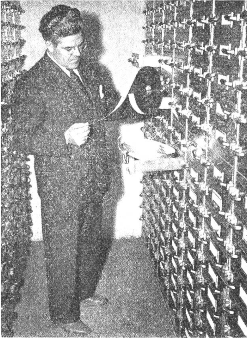
Auf Filmrollen läuft die Geschichte ganzer Kongresse. Jede Rolle besitzt zum Schutze gegen Feuergefahr ihr eigenes Stahlfach.

richtenmaterial, ja die Zusammenkünfte selbst sind dort in der Zahl von vielen Millionen als bleibende Dokumente kopiert, photographiert, gefilmt oder auf Schallplatten festgehalten. Die Aufbewahrung und Katalogisierung des umfangreichen Materials geschieht nach neuesten wissenschaftlichen Methoden; denn das Tagebuch soll nicht nur Augenblickswert besitzen, sondern künftigen Geschlechtern überliefert werden. Trotzdem ist das Archiv gleich einem privaten Tagebuch für den Zeitgenossen von einem gewissen Geheimnis umgeben, birgt es doch neben allgemein bekannten Reden, Briefen und Lichtbildern auch die Akten sämtlicher Ministerien, in welche nur wenige Menschen, darunter der vom Kongress gewählte Direktor, Einblick erhalten. H. Sg.