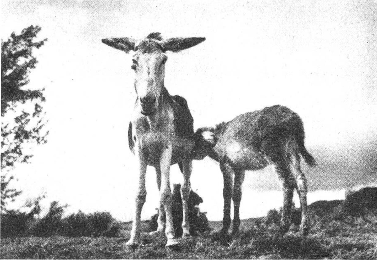
Alte Eselstute mit ihrem Fohlen.