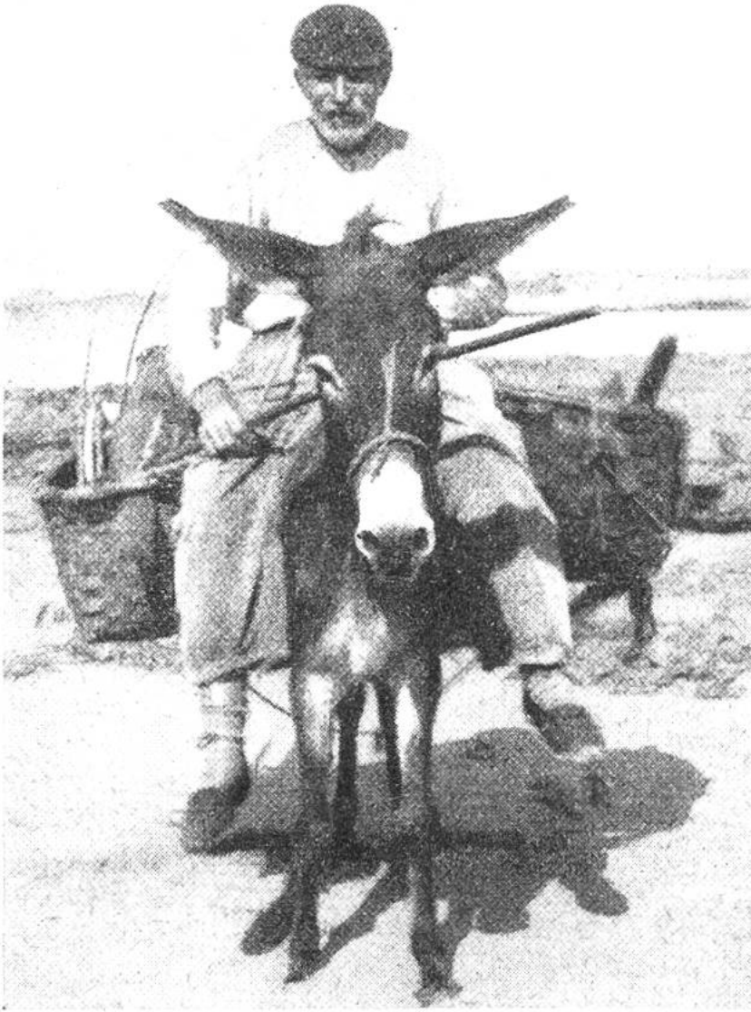
Zur reichlich bemessenen Last kommt in der Regel noch diejenige des Reiters hinzu.

strenge Schutzmassnahmen versucht man in Afrika, die letzten Reste ihres Stammes zu erhalten. Die eine Art ist der kleinere nubische Esel mit dem scharf abgehobenen Schulterkreuz, das bei den meisten Zwergeseln noch deutlich in Erscheinung tritt. Die andere Art ist der grössere Somali-Wildesel mit kaum ausgebildetem Aalstrich und mit den lebhaft quergestreiften Beinen. Vom Südrand des Mittelmeeres, wo wir uns das Entstehungszentrum der Hausesel denken müssen, hat sich dieser überaus nützliche Arbeitsgehilfe des Menschen nach Südeuropa, nach Südostasien, nach dem nördlichen Afrika, aber auch nach Südamerika ausgebreitet. In heissen, trockenen Ländern ist der Esel – neben dem Kamel – bis auf den heutigen Tag das wichtigste Trag- und Reittier geblieben.