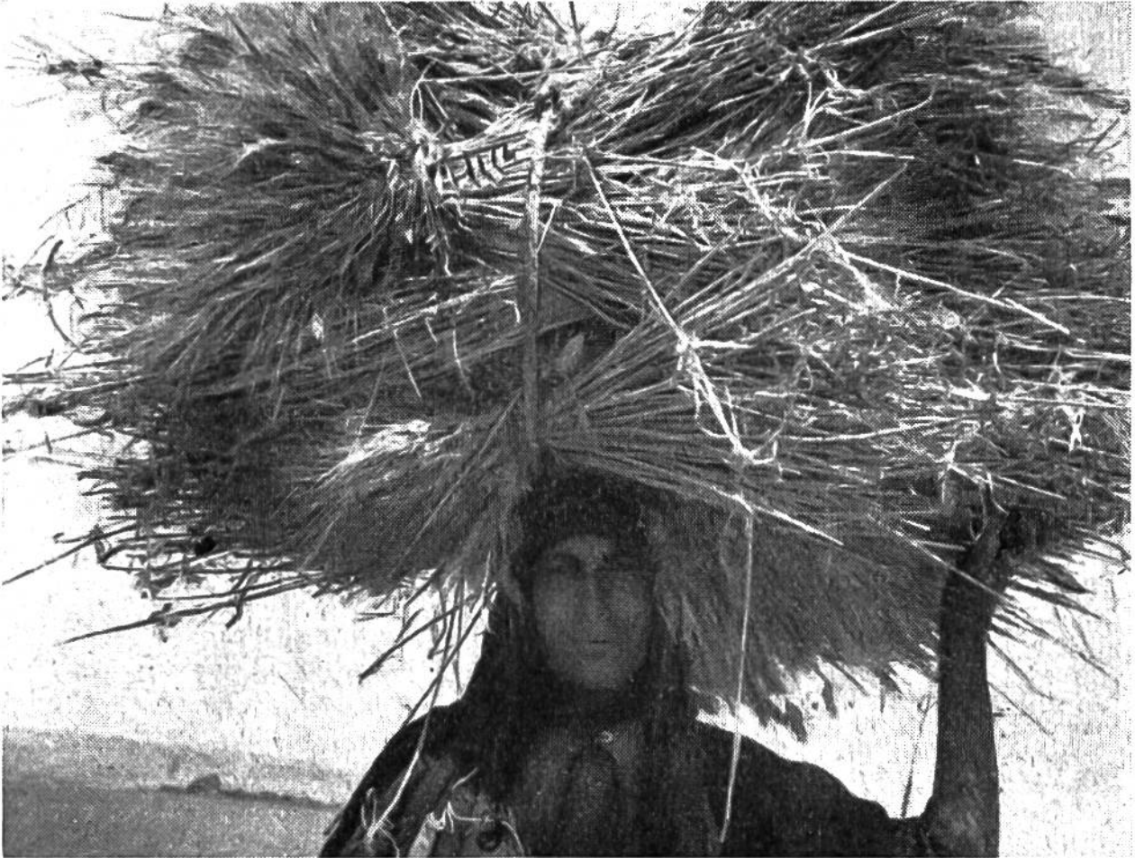
Beduinenfrau der syrischen Steppe mit einer Getreidegarbe.