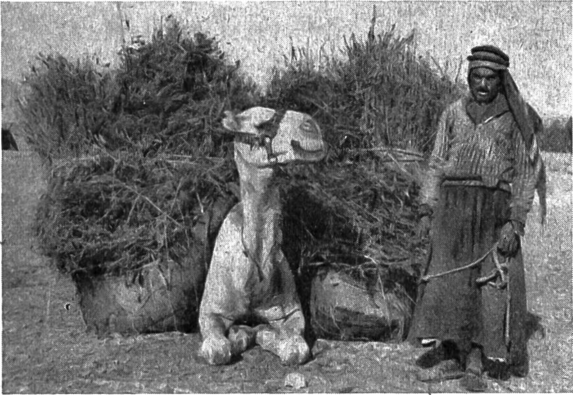
Der „Erntewagen“ der syrischen Steppe.

Büscheln und Garben, welche der Steppenboden nach mühevoller Pflanzarbeit hergibt, um die Menschen mit Brot zu versorgen. Die Felder sind mager und karg und dauernd von wucherndem Steppengras, von Moosen und Flechten bedroht, in denen das keimende Saatkorn allzu leicht erstickt. Kurzes Stroh, dünner Stand der Halme, kurzährige, stachelige Fruchtschoten – eine Art von verkümmertem Stachelweizen – versprechen keinen grossen Ertrag. Wie überall im älteren Ackerbau und in der Gewohnheit primitiver, vom Fortschritt der Technik unberührter Naturvölker, wird das Getreide bei den Arabern der syrischen Steppe in der Vollreife, d. h. wenn die Körner auf den stehenden Pflanzen völlig reif und lufttrocken geworden sind, geschnitten. Sorgfältig wird Büschel um Büschel mit der Sichel gemäht, und es bedarf wegen des leichten Ausfallens der dünnen Körner besonderer Behutsamkeit, da die Verbindung des Kornes mit der Mutterpflanze nur noch ganz lose ist. – Wir in Europa wie in allen fortgeschrittenen Kulturländern schneiden das Getreide mit der Sense oder mit der rascher arbeitenden Maschine und mit dem modernen Bindemäher und haben den