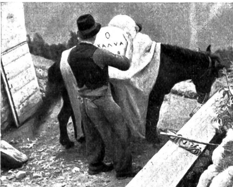
Die gepressten jungen Käse werden auf ein Maultier geba- stet und zum Käsekeller im Tal gebracht.

Die Käsebereitung auf den Alpen ist seither stark zurückge- gangen. In reinen Alpenkantonen aber kennt man auch heute noch die regelmässige Kuhalpung und die sommerliche Alp- käserei. Die Sennen stellen dabei meistens einen vollfetten