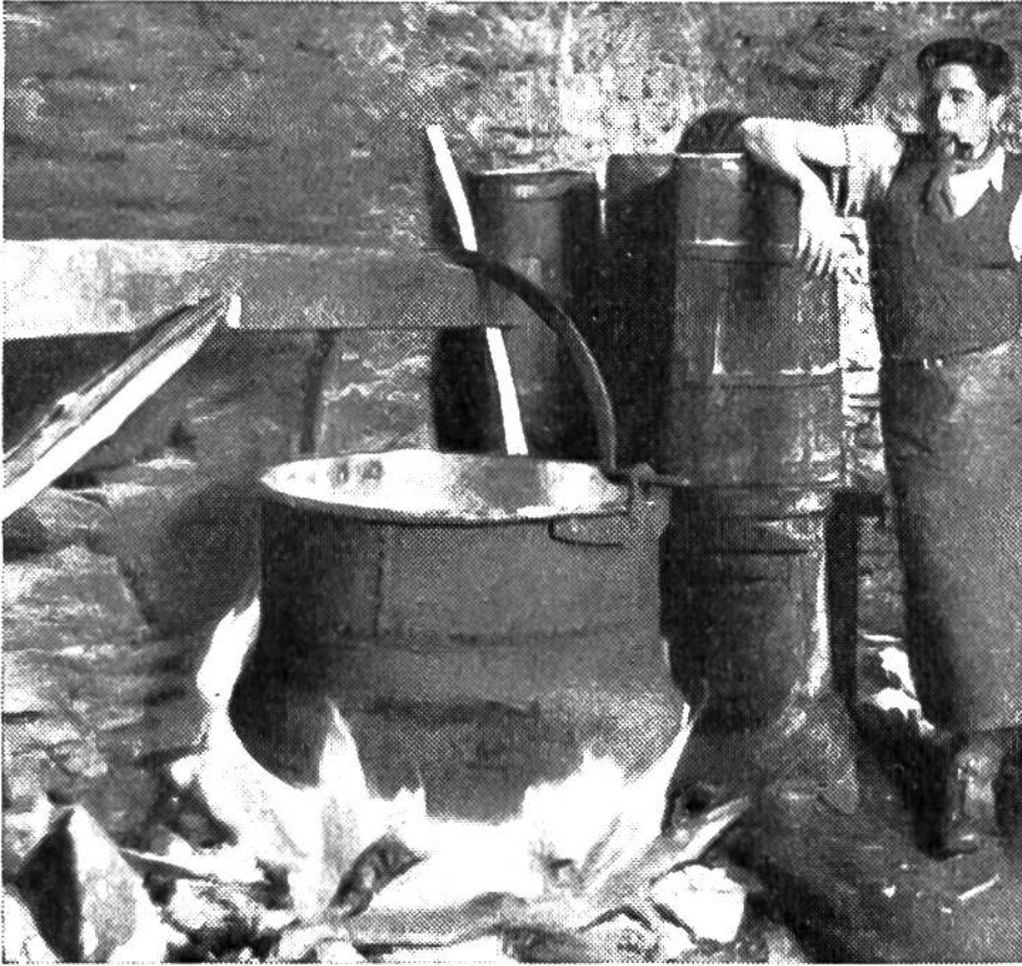
Am Herdfeuer der Sennen. Das Käsen be- ginnt.

Die Käsebereitung auf den Alpen ist seither stark zurückge- gangen. In reinen Alpenkantonen aber kennt man auch heute noch die regelmässige Kuhalpung und die sommerliche Alp- käserei. Die Sennen stellen dabei meistens einen vollfetten