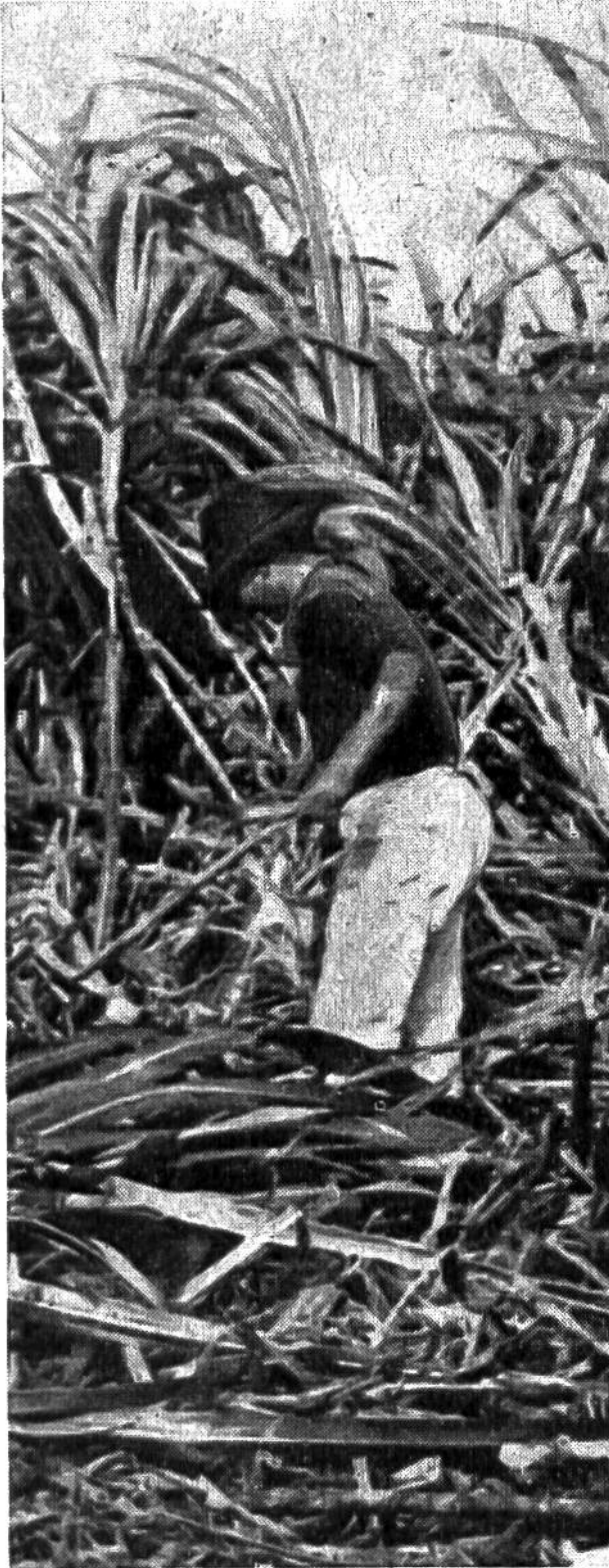
Ernte des über mannshohen Zuckerrohrs mit der Machete.

Kaum sind die internationalen Versorgungsschwierigkeiten des letzten Weltkrieges für Zucker einigermaßen überwunden,