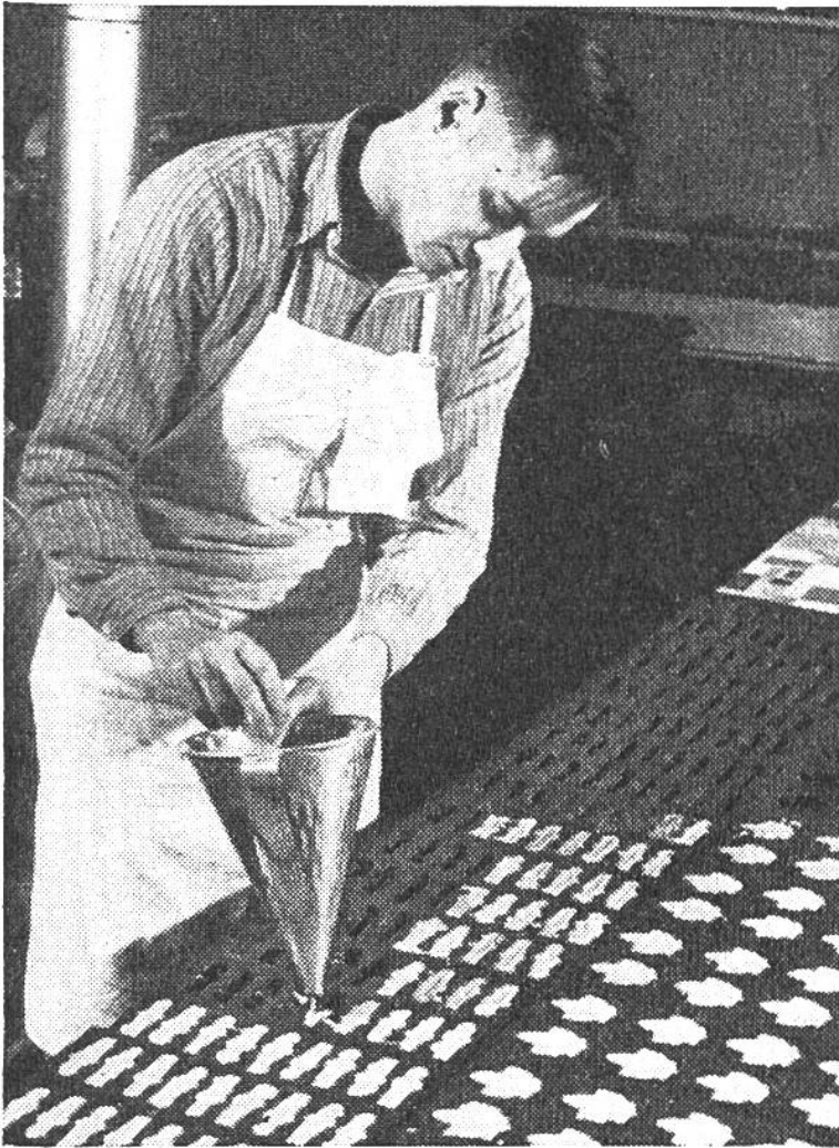
Herstellung von Konfiseriewaren aus Ahornzucker. Im Vordergrund rechts Ahornblätter, das Wahrzeichen Kanadas.

der vermag aber Kanada seinen Zuckerbedarf nicht aus der eigenen Produktion zu decken.