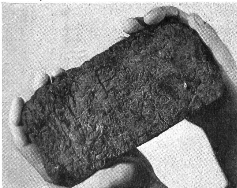
Die Siwasha-Indianer in Alaska bezahlten noch im 19. Jh. mit hartem Brot.

Europäern eingeführte Glasperlen sein, die einen gewissen Seltenheitswert besitzen und deshalb Zahlungsmittel darstellen; es mögen – in Melanesien, der im Nordosten Australiens gelegenen Inselreihe – sogar Tierzähne die Bedeutung von Geld erlangen, wobei in der üblichen Wertstufung ein ringförmig gewachsener Eberzahn den Wert von 200 Hundezähnen ausmacht. Das eigenartigste Geld auf unserem Erdrund stellen wohl die Yap-Steine dar; sie dienen auf der Insel Yap in der Südsee als Zahlungsmittel, das kaum je einer Fälschung ausgesetzt ist. Denn diese grossen und schweren Steine werden auf einer 500 km entfernten Insel gebrochen und auf eigens dazu gebauten Flössen herangeschafft, um dann – mit einem Mittelloch versehen – an Stangen über der Schulter getragen zu werden.