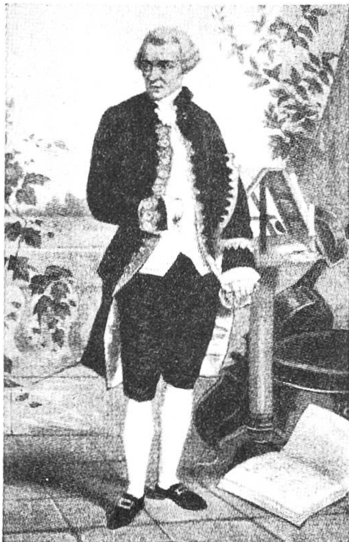
Haydn in Galakleidung als fürstlich Esterhazyscher Kapellmeister.