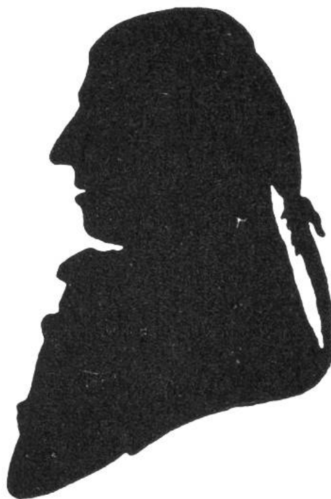
Joseph Haydn. Nach einem zeitgenössischen Schattenriss.

Im Winter 1790 unternahm Haydn eine Konzertreise nach Paris und London. Sein Ruhm war längst in alle europäischen Länder gedrungen, die Verleger wollten immer wieder neue Werke drucken; und so schrieb er die Pariser und Londoner Sinfonien, unter anderem die «Sinfonie mit dem Paukenschlag», die wieder einmal einen besonders humorvollen Gedanken verwirklichte. Da nämlich in den Hofkonzerten, die gewöhnlich kurz nach einer üppigen Mahlzeit stattfanden, sehr oft eine Anzahl der vornehmen Besucher einschief, schreckte er diese nach einem ruhevollen langsamen Satze unvermittelt durch einen kräftigen Paukenschlag auf, damit sie wenigstens den nächsten Musiksatz nicht versäumten! Der Scherz schadete seinem Ruhme keineswegs. Von der Universität Oxford erhielt er den «Ehrendoktor für Musik», und eine zweite Reise nach London im Jahre 1795 wurde wiederum