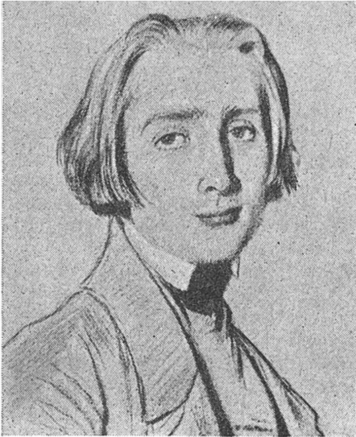
Franz Liszt, 1835 von dem französischen Maler J. A. D. Ingres, Paris, gezeichnet.