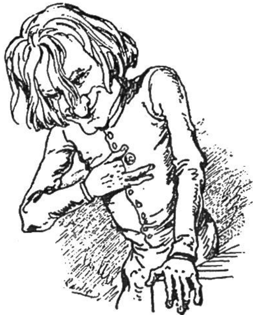
So sah der Karikaturist den Pianisten Liszt – bald sanft, bald wild, selbstvergessen bis zur Schlussverbeugung. (Die Zeichnungen sind mit der freundlichen Genehmigung des Verlages dem «Atlantisbuch der Musik» entnommen.)