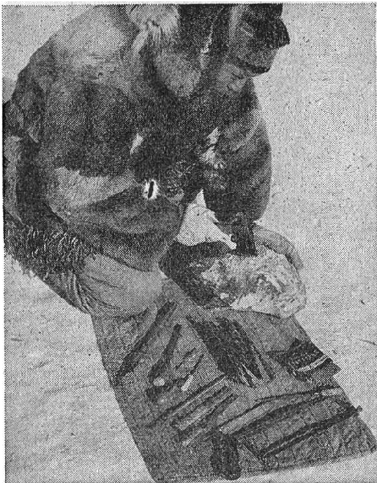
Mit modernen Instrumenten macht sich der Jägerkünstler daran, das Specksteinstück in eine Figur zu verwandeln.

verfolgen. Sie haben eine natürliche Begabung, die es ihnen erlaubt, nach harter Jagd in Mussestunden ihre Waffen und Geräte mit Tier- und Menschenfiguren zu verzieren. Allmählich ging diese Tradition aber weitgehend verloren. Neuerdings haben nun Missionare und Regierungsbeamte die Eingeborenen in Arktisch Kanada veranlasst, sich diese Fähigkeit zunutze zu machen, um zu einem kleinen Nebenverdienst zu gelangen. Es handelt sich um etwas Ähnliches wie bei den Arbeiten unserer Bergbauern, die in den Städten verkauft werden. Nur verraten die Figuren der kanadischen Eskimos, dass diese noch wenig mit der Zivilisation in Berührung gekommen sind. Es geht nicht einfach darum, eine Figur für den Verkauf herzustellen: der Jägerkünstler lebt noch weitgehend in der Gedankenwelt, die er in seinen Plastiken zum Ausdruck bringt. Er stellt die Tiere dar, die er jagt, um leben zu können; ferner Erlebnisse aus seinem Dasein; und nicht selten sind es altüberlieferte Geschichten oder Legenden, die den Stoff liefern.