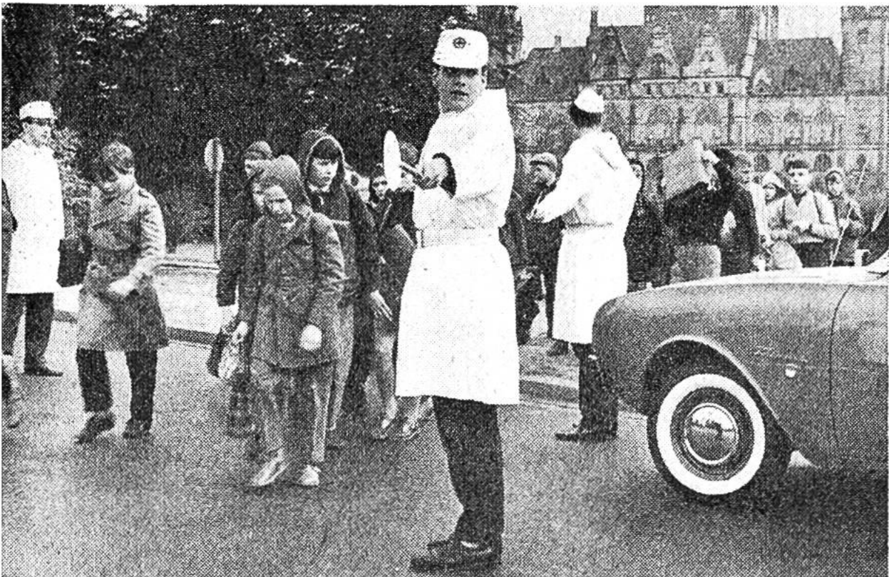
Schüler-Verkehrshelfer «im Dienst». Von ihren uniformierten Helfern beschützt überqueren die Mitschüler die verkehrsreiche Strasse.