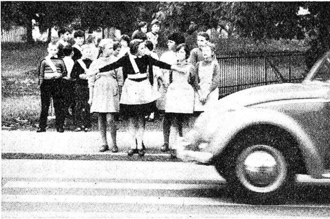
Die Schüler-Verkehrshelferin stoppt mit Handzeichen ihre Mitschülerinnen und gibt dem Auto die Bahn frei.