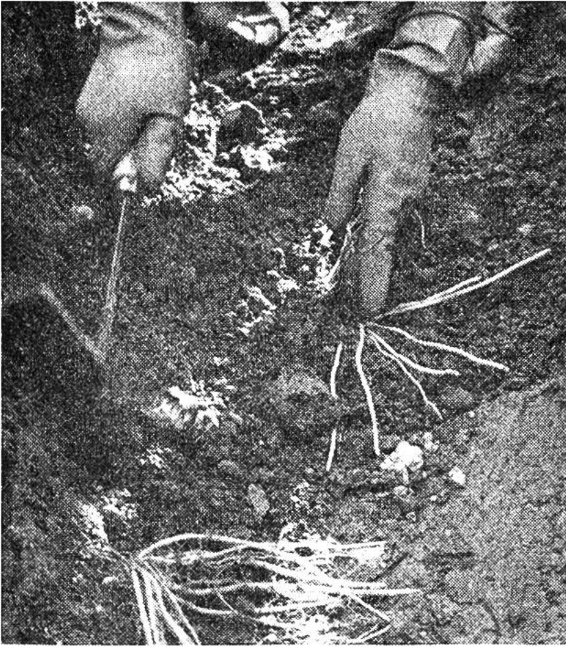
Die Spargel besitzen ein sehr ausgedehntes Wurzelwerk, dem man beim Pflanzen der kleinen, einjährigen Setzlinge bereits Rechnung tragen muss.

aus ihren Achseln wachsen die zu Scheinblättern entwickelten Kurztriebe. 2. Die Spargelpflanzen sind zweihäusig; es gibt also Pflanzen, die nur weibliche, und solche, die nur männliche Blüten tragen.