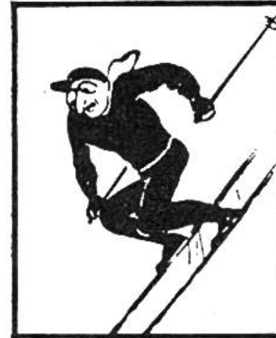
Im Schatzkästlein Seite .....