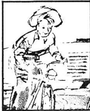
Im Kalender Seite .....