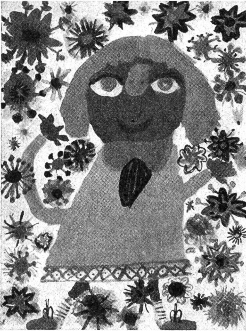
«Ich im Blumengarten», Aquarell aus der Erinnerung von Brigitte Ulrich (7 Jahre), Basel.

7. Preisverteilung: Die Herausgeber des Pestalozzi-Kalenders behalten sich vor, je nach Beteiligung und Leistung, die Preise nach Gutfinden auf die Wettbewerbe zu verteilen.