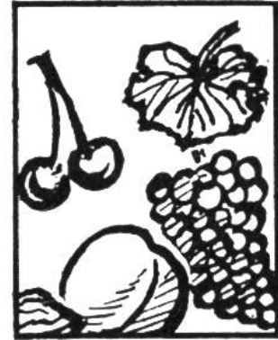
Im Kalender Seite.....