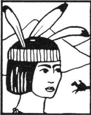
Im Schatzkästlein Seite .....

Welchen Bildern im Kalender und Schatzkästlein sind untenstehende Teilstücke entnommen? Angabe der Seiten genügt.