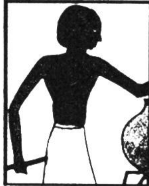
Im Kalender Seite.....