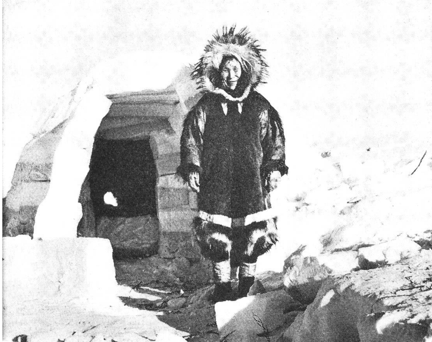
Der Baumeister vor seinem fast vollendeten Werk, dem aus Schneeblöcken gefügten, kuppelförmigen Iglu.

nenraum wird nun als Familienbettstatt eine breite Schneebank angelegt. Über den Schnee kommen zunächst Reisigbündel und dann mehrere Karibufelle zu liegen. Durch einige ausgeschnittene Öffnungen, in die eine durchsichtige Eisplatte eingesetzt worden ist, fällt das bleiche Tageslicht in den Raum. Ohne dass geheizt wird, hält sich in einem mittelgrossen Iglu die Temperatur zwischen 10 und 15 Grad unter Null, was eine um 35 bis 40 Grad höhere Temperatur als im Freien bedeutet. An günstigen Lagen wird der Iglu zudem allmählich vom Flugschnee zugedeckt. Dann hält sich der Innenraum noch wärmer. Ausserdem verstehen es die Eskimos, ihre Schneehäuser durch Mauern vor den kalten Stürmen zu schützen oder gar durch Doppelwandungen zu isolieren.