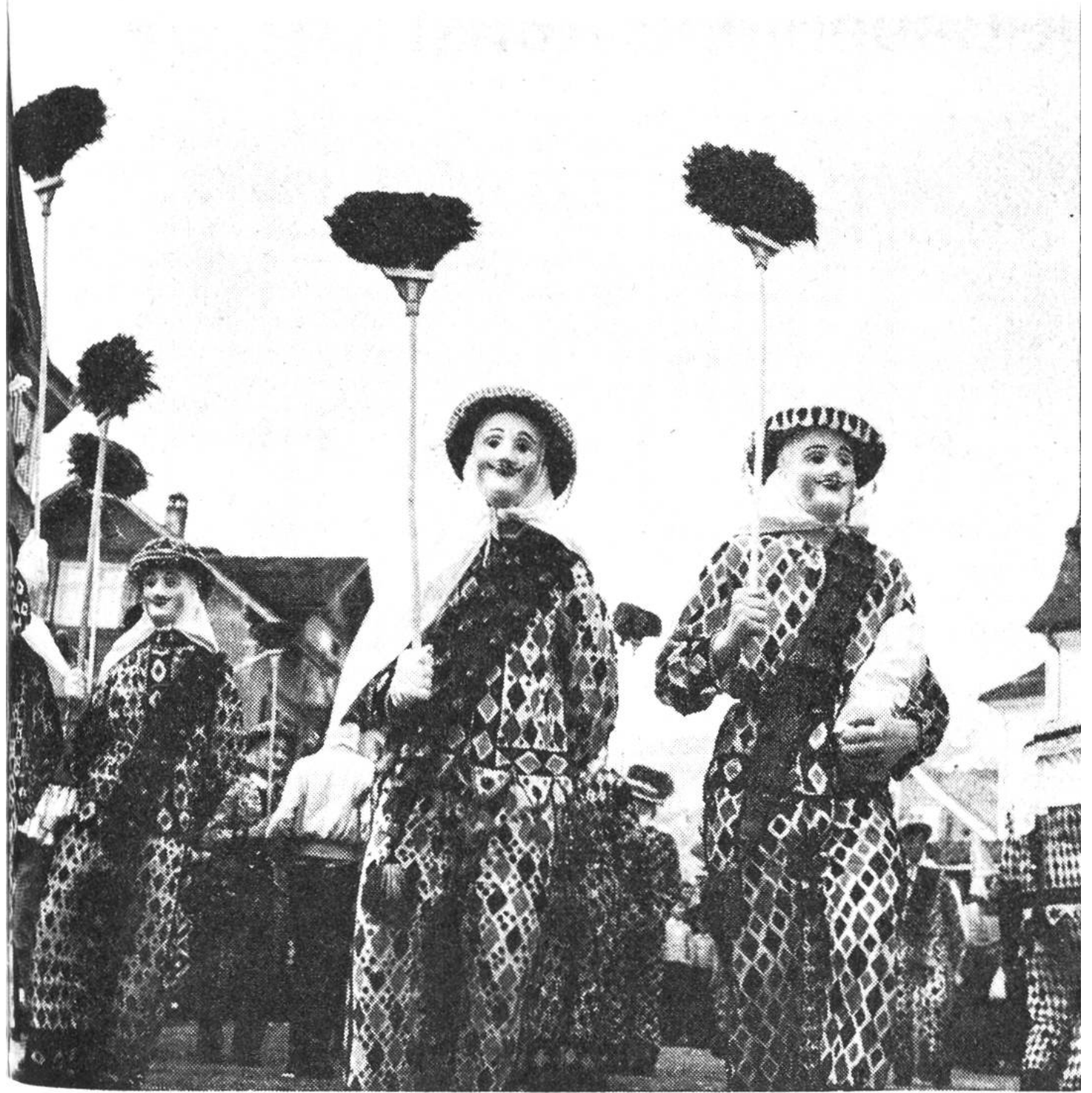
Die Schwyzer Fasnacht auf dem Höhepunkt.