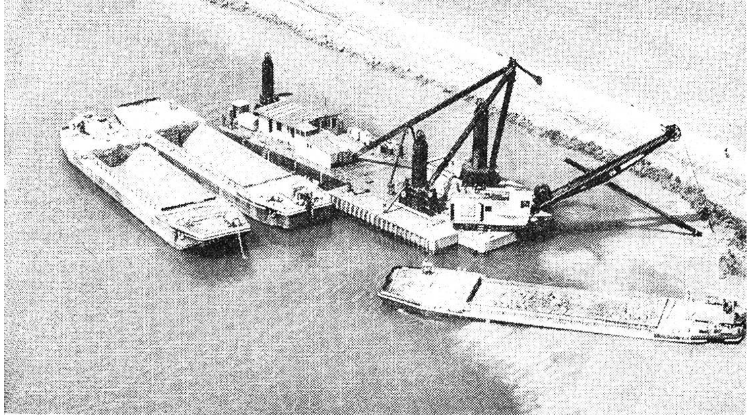
Der grosse amerikanische Schwimmbagger beim Verbreitern des Nidau-Büren-Kanals mit drei Klappschiffen zu je 500 Tonnen.

Welches ist das Ziel der Zweiten Juragewässerkorrektur?