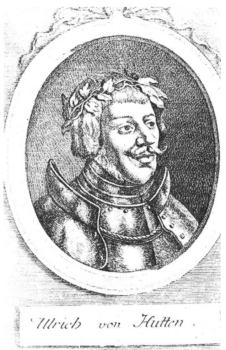
Ulrich von Hutten