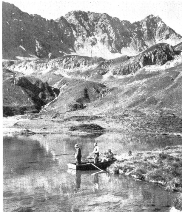
Abb. 1. Forellenfang im Hochsee.