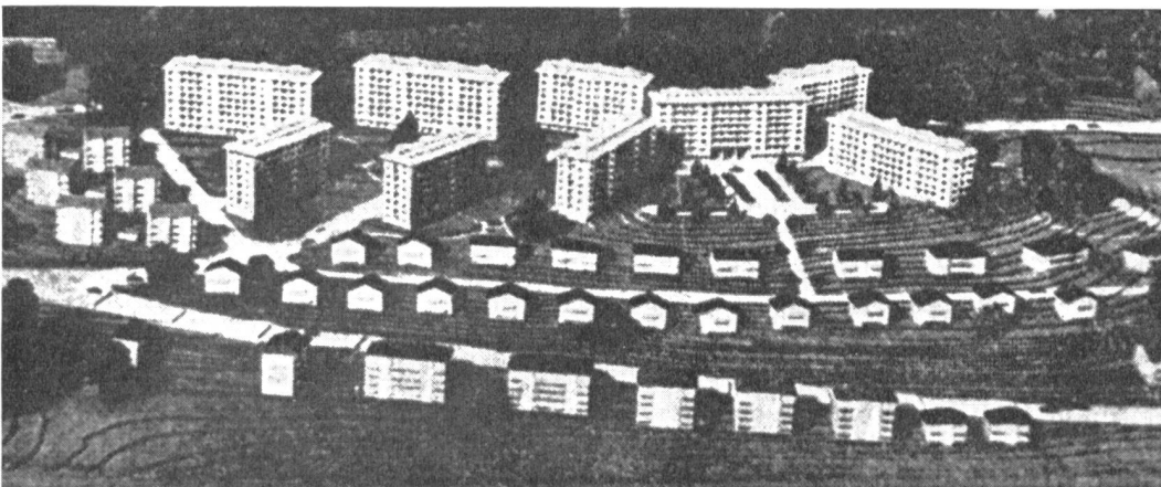
Prilly, wie es ausgeführt wird. Keine Rücksicht auf die Topographie. Das Ganze wird als Ebene behandelt und eine unerhörte Dichte herausgeholt.

Warum wurde das Projekt nicht ausgeführt? — Durch Vorträge und Zeitungsartikel versuchen die Architekten die Öffentlichkeit aufzuklären. Der erste Erfolg stellt sich ein: Die Behörden bewilligen den Bau von Hochhäusern! Da sieht der Grundbesitzer eine Möglichkeit, seine Gewinne noch zu vervielfachen. Unternehmer liefern ihm ein Projekt, das durch radikale Vermehrung und Vergrösserung der Hochhäuser den Boden bis zum Letzten ausnützt. Auf die Topographie wird keine Rücksicht genommen, sondern durch Symmetrien wird versucht, ein kleines Versailles vorzutäuschen. Heute entsteht ein normales Mietshausviertel mit seinen bekannten Nachteilen — nur in einem vergrösserten Maßstab.