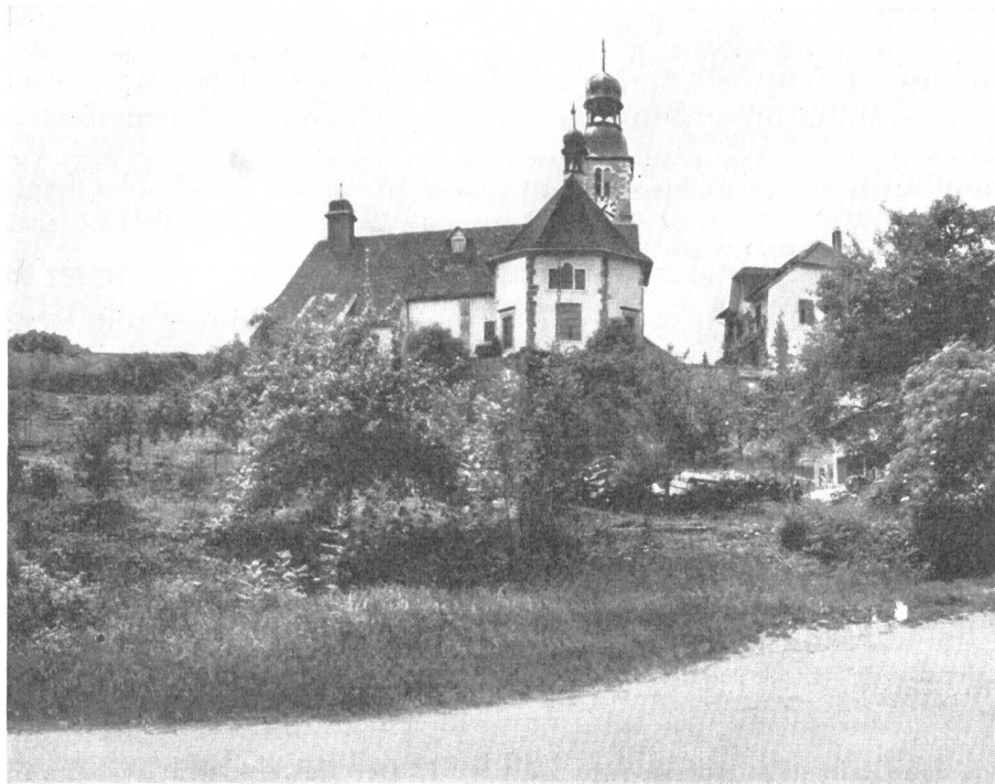
Blick von der Kantonsstrasse, die zum Weissenstein führt, auf die Kirche Oberdorf.