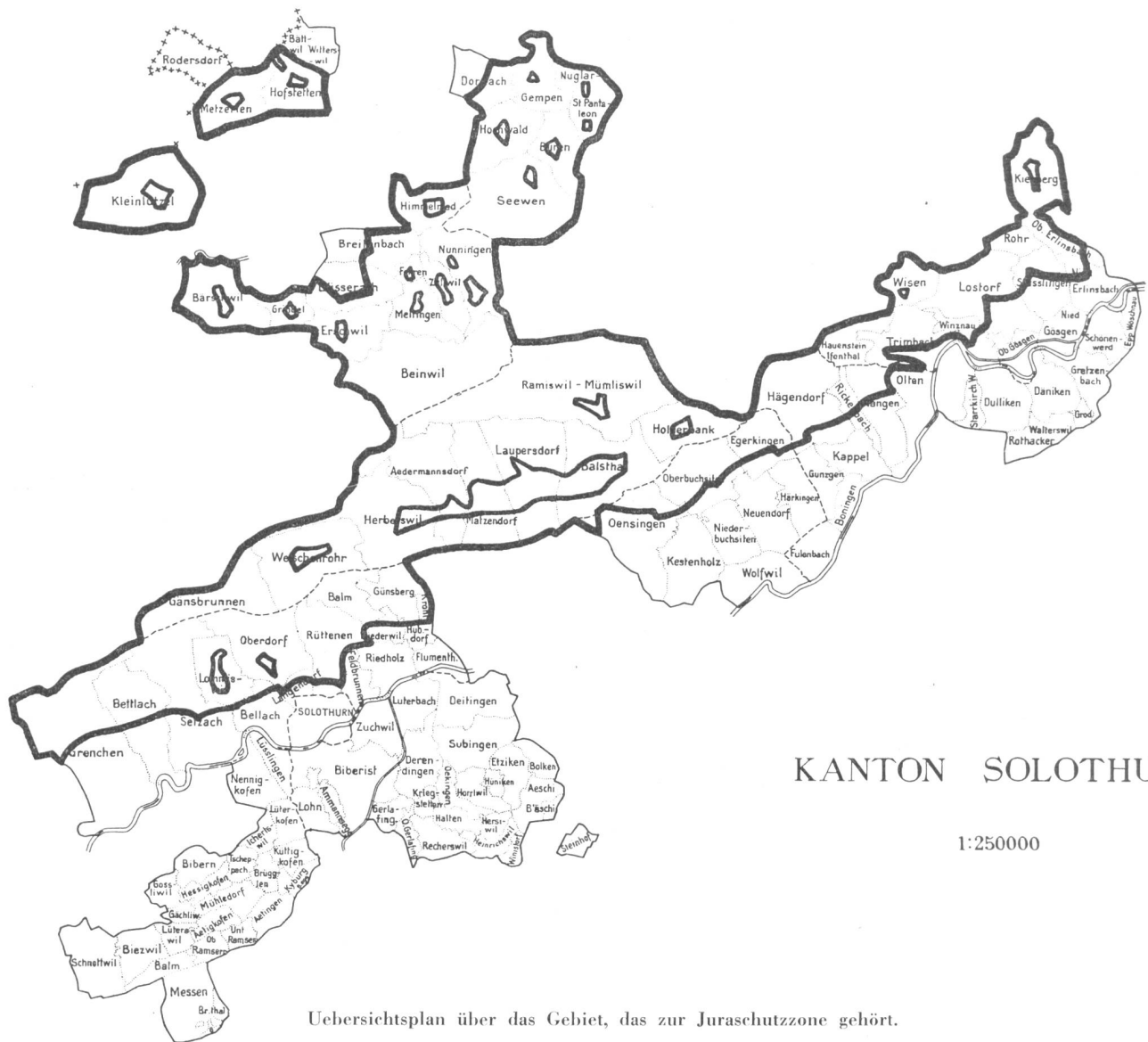
Übersichtsplan über das Gebiet, das zur Juraschutzzone gehört.

Bundesgerichtes i. Sa. B. Goetz c. Regierungsrat des Kantons Solothurn vom 11. Juli 1951, zitiert in Zbl. 1952, S. 11 ff.) Fraglich mag erscheinen, welche Bedeutung den Schutzzonen, die der Regierungsrat im Einverständnis mit den Gemeinden festgelegt hat, materiellrechtlich zukommt. Unseres Erachtens wird durch die Schutzzone das Gebiet abgegrenzt, für welches an die ästhetischen Anforderungen der Bauten hinsichtlich Lage und Gestaltung erhöhte Anforderungen gestellt werden. Die generelle Genehmigungspflicht der Bauten im Schutzgebiet durch den Regierungsrat sorgt zudem für eine einheitliche Beurteilung der Anliegen des Natur- und Heimatschutzes.