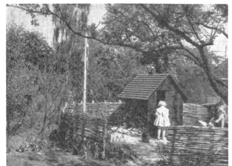
Spezialgarten für Kinder: Ein eigener Garten, mit einem kleinen Hüttchen, beglückt jedes Kinderherz und lässt seiner schöpferischen Phantasie freien Lauf.

Es scheint uns auch heute noch der Mühe wert, zwei dieser Spezialgärtchen herauszugreifen und deren praktische Verwirklichung weiteren Kreisen zu empfehlen. Vg.