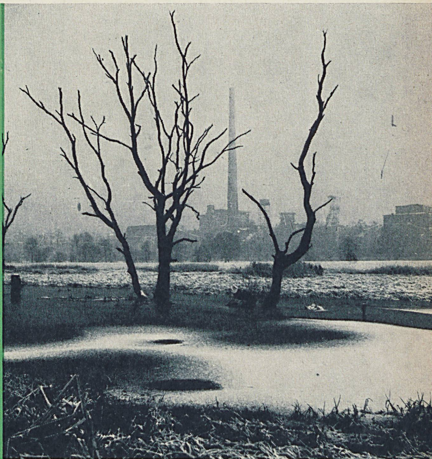
Folgen des Bergbaus: Eine mit Grundwasser gefüllte Senkungsmulde im Ruhrgebiet