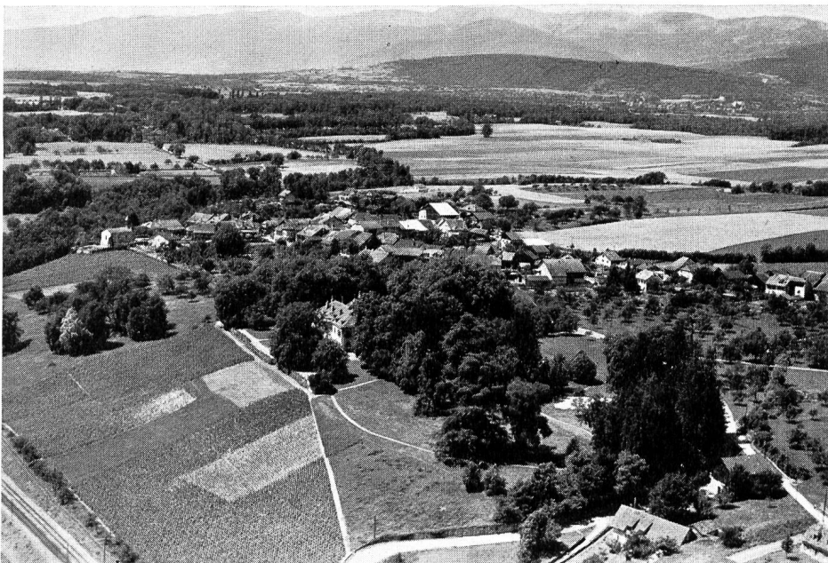
Fig. 2. Crans; on distingue nettement le coteau privilégié qui longe la rive, le palier intermédiaire qui peut demeurer agricole et les dernières pentes du Jura pour lesquelles cette zone agricole constitue un admirable premier plan de verdure.

De plus, une croissance organique des vingt villages du plateau et du pied du Jura peut être envisagée. Ces villages, qui comptent actuellement environ 5000 habitants, pourraient — sans trop de perturbation de leur vie communale et de dommages pour les terres agricoles — doubler de capacité. Il serait souhaitable, afin de s'harmoniser avec les