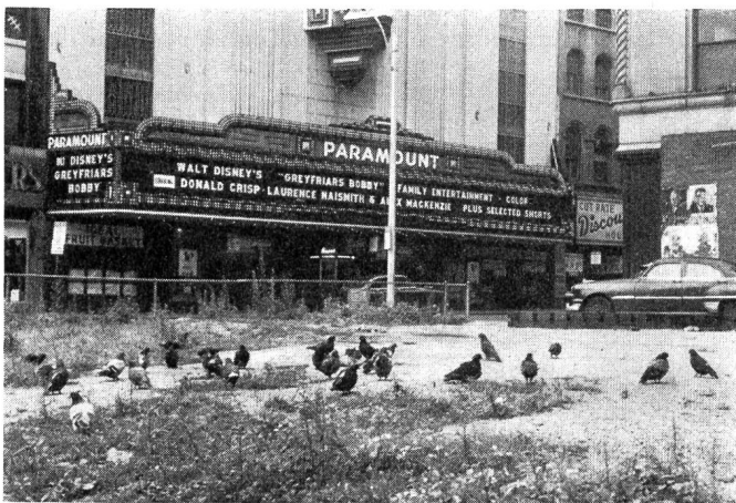
Abb. 8. Nicht der Parkplatzmangel, sondern die Abwanderung der Wohnbevölkerung in die Vororte ist der Hauptgrund für das Absterben der Stadtkerne. Gegenüber vom Paramount-Kino an Bostons Washington Street benützen die Tauben den verlassenen Parkplatz.

nicht mehr versucht, die Stadtentwicklung ausschliesslich durch negative Verbote, Baulinien, Mindestmasse usw. zu leiten, sondern es werden «Incentives» (Vorteile) demjenigen geboten, der mithilft, die Ziele der Stadt zu realisieren. Es wird bei grösseren Bebauungen eine bessere Ausnutzung erlaubt, da bei diesen auch bessere Verkehrsanschlüsse, Lichteinfall-Verhältnisse usw. möglich sind. So werden z. B. mit dem «Sky Exposure Plan» der New-Yorker Bauordnung der Kubus und die Höhe der Gebäude durch geneigte, von den Grenzlinien aufsteigende Ebenen kontrolliert. Natürlich kann nun auf kleinen Einzel-Parzellen weniger gebaut werden als auf entsprechend zusammengelegten Grundstücken. Es ist also wirtschaftlich und zugleich auch städtebaulich interessanter, grössere Parzellen nach einem verbindlichen Gesamtplan zu entwickeln. Der Kontrollwinkel der geneigten Ebenen wird ferner je nach Umgebung und nach Schaffung offener, öffentlicher Flächen geändert. Es kann neben einer Einfamilienhaus-Zone nicht plötzlich ein Hochwohnhaus stehen, sondern eine flache Kontrollebene bürgt für harmonischen Uebergang, sogenanntes «Transition Zoning».