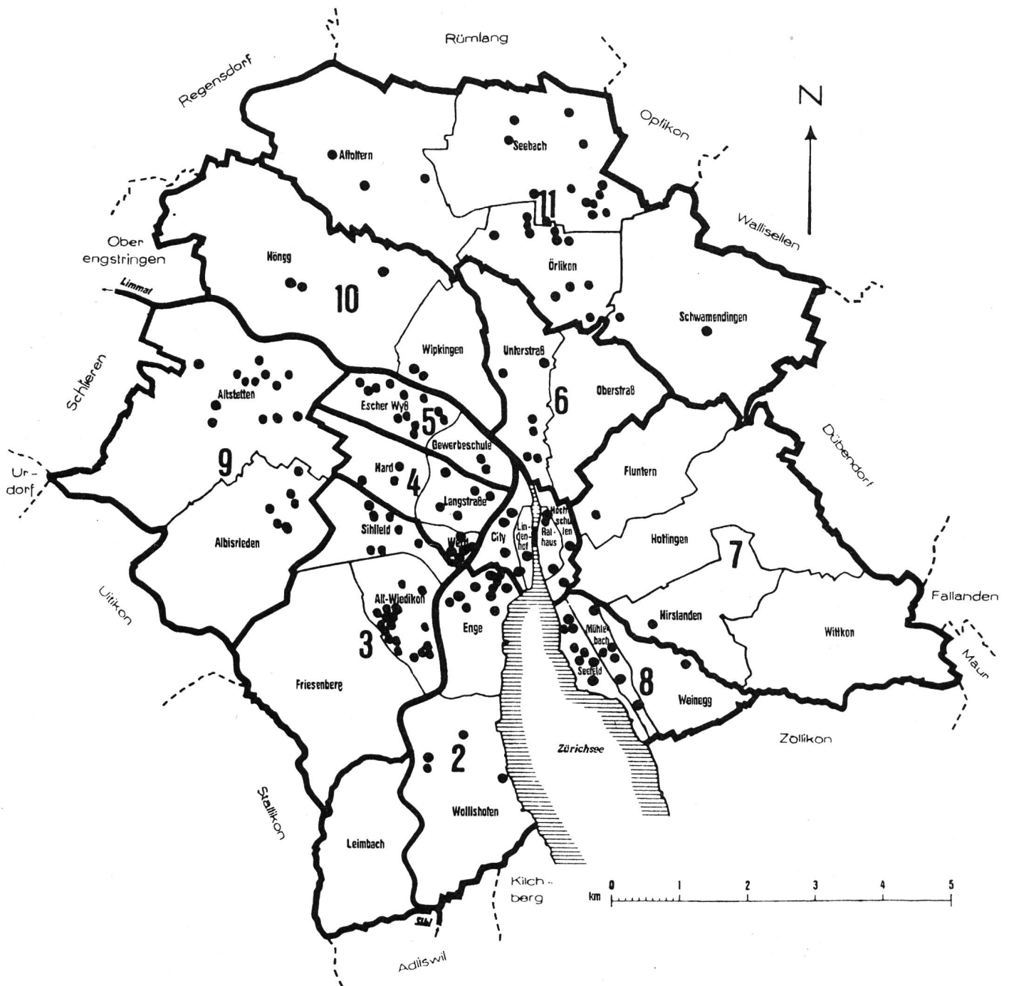
Abb. 1. Neue Büro- und Gewerbebauten in Zürich am 1. Januar 1962 (baubewilligt und im Bau befindlich).

umliegende Region herausgewachsen, ohne aber bis heute eine dem neuen regionalen Städterraum angepasste Struktur anzunehmen. Aus dem idyllischen Seldwyla wird eine Region der dutzendweise aneinandergereihten Seldwylas. Die Bahnhofstrasse in Zürich ist nicht mehr ein Zentrum von nur 100 000 Einwohnern, sondern sie ist Zentrum einer geplanten Region von 1 1/2 Mio Einwohnern; dazu kommt ihre Bedeutung als europäischer und Weltwirtschaftsplatz. Warum sollen wir diese innere Wandlung äusserlich verstecken? Warum soll Zürich die Zwangsjacke Seldwylas nicht ausziehen und eine seiner Bedeutung und Funktion angemessene Form annehmen?