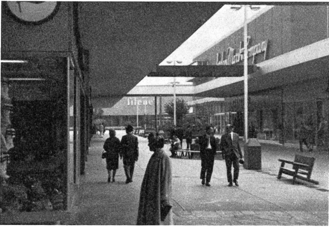
Abb. 6. Neue «Shopping Centers» mit schönen, autofreien Fußgänger-Ladenstrassen mit genug Parkplätzen locken die Einkäufer der Vorortgemeinden an.