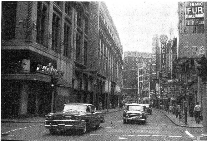
Abb. 7. Whites' grosses Warenhaus an Bostons Washington Street wurde geschlossen. Der Riesenbau ist zu vermieten. Folge der Motorisierung und Dezentralisation der städtischen Wohnbevölkerung.