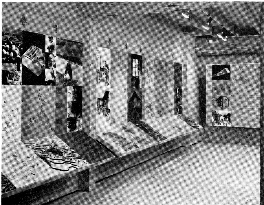
Abb. 2. Planungsarbeit von ETH-Studenten für das Dorf Bruson.

Den Abschluss der Ausstellung «Berglandwirtschaft» bildet ein Ueberblick über die verschiedenen Berggebiete der Schweiz, die an speziellen Problemen, wie der bäuerlichen Selbsthilfe, des Zusatzverdienstes usw., illustriert werden.