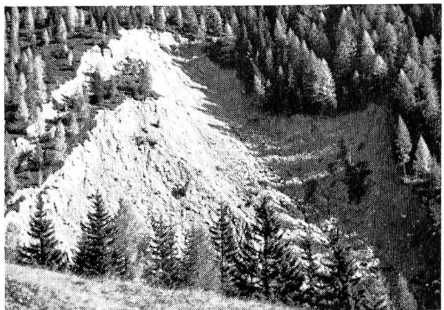
Anbruchkessel im Wollinitzgraben. Die ungefähren Ausmasse sind im Vergleich mit den Bäumen ersichtlich. Der ganze höherliegende Hang ist eine grosse, im unteren Teil bewaldete Sackungsmasse und vermutlich immer in leichter Bewegung