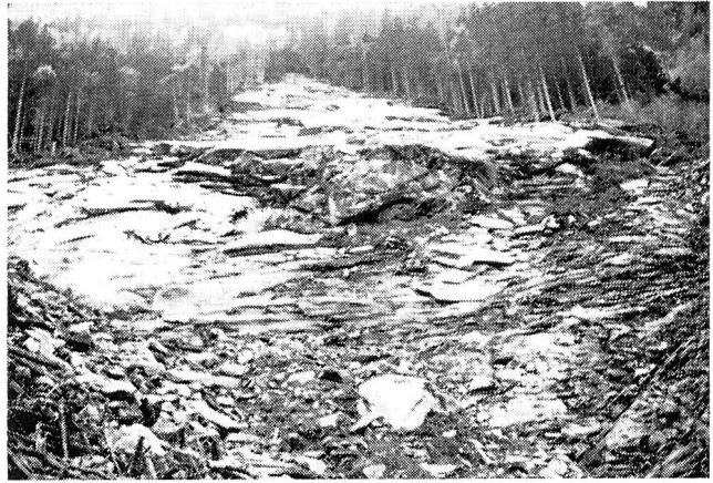
Anbruch im Maltatal. Breite etwa 80 bis 100 m, Länge etwa 150 bis 200 m. Der gesamte Waldbestand mit der ganzen Verwitterungsschwarte ist auf dem blanken Felsuntergrund abgerutscht