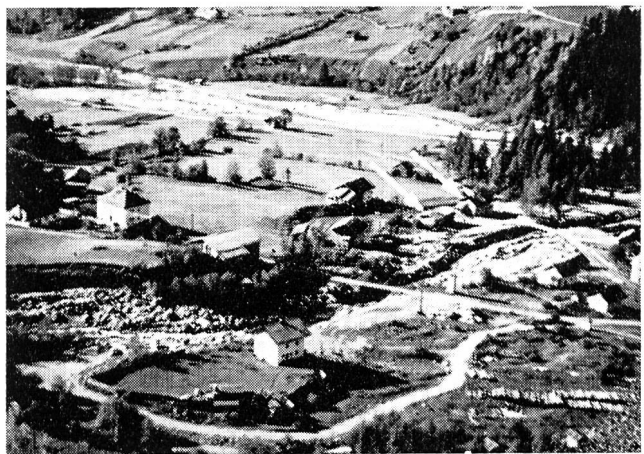
Mörtschach im Mölltal: Mitten im Hauptgefährdungsbereich des Astengrabens stehen einige neuere Wohnhäuser (Pfeile), die beim Ausbruch einer Mure stark beschädigt wurden. Nach der Instandstellung (teilweise sogar Neubau!) ist die Gefährdung nicht kleiner geworden. Aeltere, vor allem bäuerliche Anwesen stehen ausserhalb des grössten Gefahrenbereiches