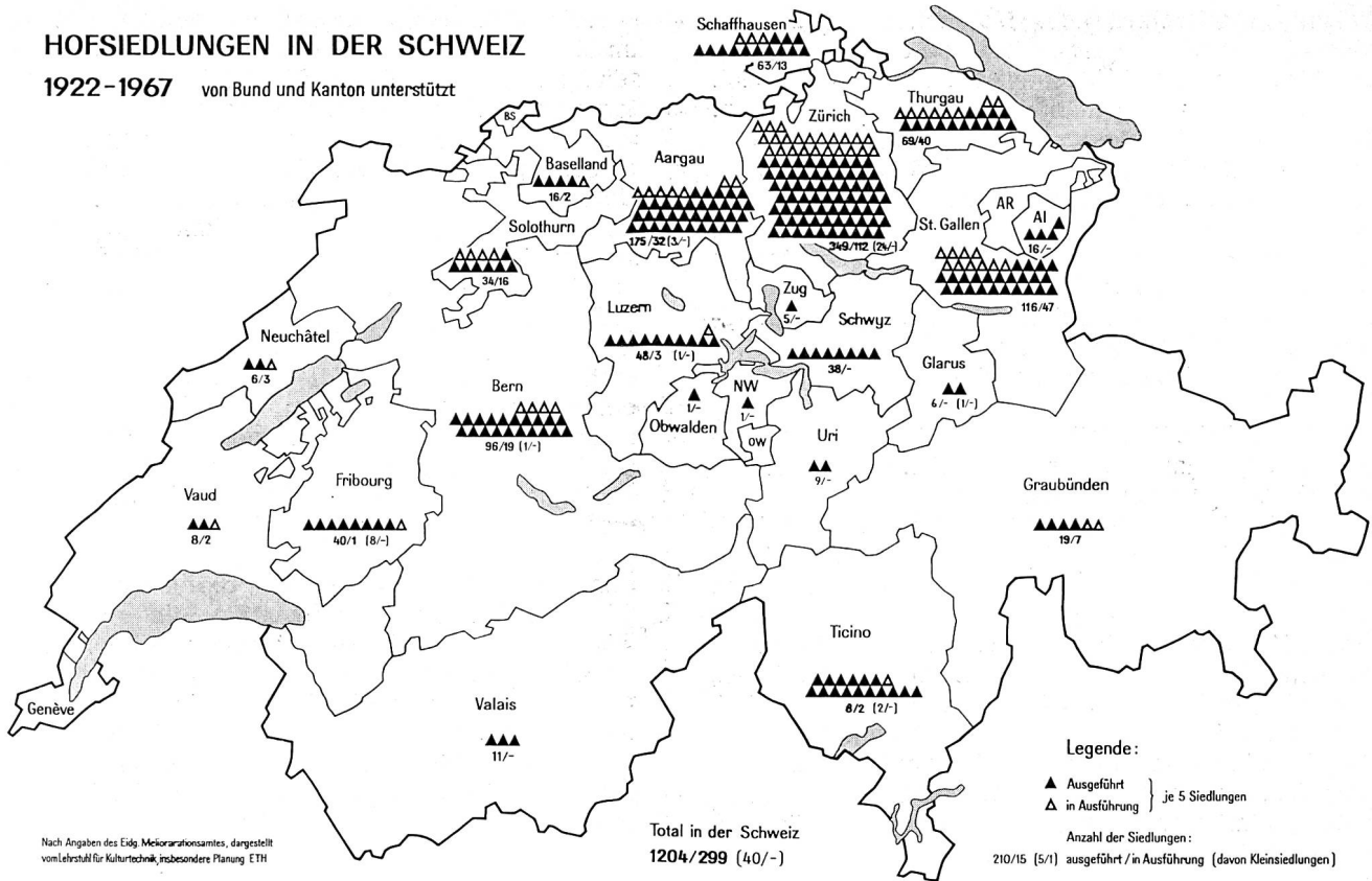
Abb. 2. Hofsiedlungen in der Schweiz 1922 bis 1967

1922-1967 von Bund und Kanton unterstützt