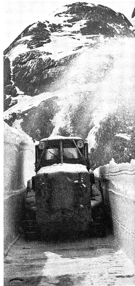
Abb. 3. Schneeräumung auf der Grimsel. Die Schneefräse befindet sich noch 6 m über dem Strassenniveau!

G. B.: Die Signalisation sollte in der Planung bei den modernen Ingenieurbüros schon ziemlich früh berücksichtigt werden — meistens ist es auch der Fall. Sicherheitsvorkehrungen gehören eigentlich in das Projekt. Im allgemeinen werden die Sicherheitsvorkehrungen auch schon bei der Ausschreibung berücksichtigt.