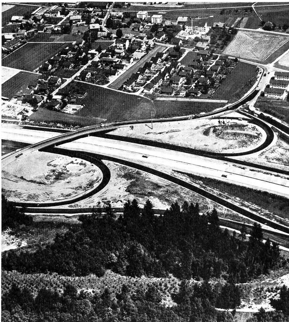
Abb. 5. N 6-Anschlussbauwerk bei Thun-Heimberg.

80 Mio Franken will der Kanton Bern in den Jahren 1971/72 für den Ausbau seines Staatsstrassennetzes aufwenden. Das Zweijahresprogramm weist die folgenden Hauptposten auf: Strassen 1. Klasse 44,6 Mio Franken, Strassen 2. Klasse 34,4 Mio Franken und Reserve der Baudirektion 0,9 Mio Franken. Herausragende Posten sind die Strecken Richiger—Grosshöchstetten (5 Mio), die rechtsufrige Brienerseestrasse (4,5 Mio), Bévillard—Sorvillier (2,3 Mio) und Kehrsatz—Hunzigenbrücke (4,5 Mio). Dazu kommen im Jahre 1971 noch 13 Mio Franken für besondere Strassenstrecken. Es sind die Taubenlochstrasse und die Autobahn Schönbühl—Lyss.