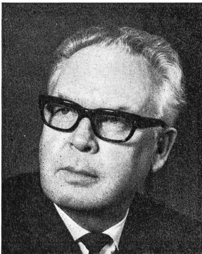
Regierungsrat Erwin Schneider

Geboren 1910, heimatberechtigt in Brugg/Biel. Sozialdemokrat. War Gewerkschaftssekretär, kantonaler Parteisekretär. Ueber 12 Jahre lang Berner Stadtrat; Grossrat; 1962 in den Berner Regierungsrat gewählt (bis 1966 Fürsorgedirektor). Ab 1966 Baudirektor; 1958 bis 1962 Nationalrat; Nationalrat wieder seit 1970. Wohnt in Kehrsatz. Verheiratet; ein erwachsener Sohn.