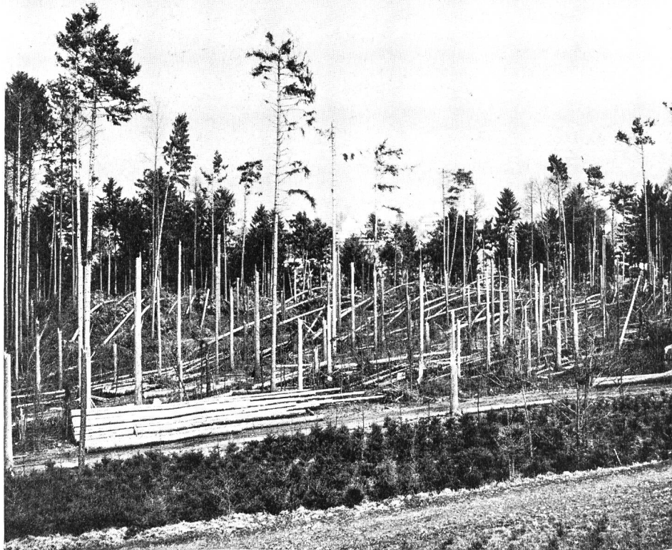
Abb. 3. Schwere Windfallschäden in der Waldung der Holzcorporation Bannegg-Thalwil in Zusammenhang mit dem schroffen Waldaushieb für die N 3.

Die Durchschneidung grösserer Waldgebiete ist somit in mancher Hinsicht unerwünscht. Die Strassenbauorgane sind sich dieser Tatsache durchaus bewusst. Es muss daher immer wieder befremden, mit welchem Nachdruck der Forstdienst die Forderung der Walderhaltung vertreten und durchsetzen muss. Das kommt daher, dass die endgültige Trasseewahl sehr oft mehr von politischen als von technischen, mehr von ökonomisch-finanziellen als von sozialhygienisch-ideellen Ueberlegungen abhängt. Wir kennen gesamtschweizerisch verschiedene Fälle, wo alle Fachinstanzen — Strassenbau, Gewässerschutz, Forstdienst, Landschaftsschutz — in sorgfältiger Abwägung eine tragbare Linienführung studierten, während sich in der Folge Gemeindebehörden oder politisch einflussreiche Kreise bemühten, das Trasse auf grössere Längen in den Wald hinein zu verdrängen. In der Regel geht es dabei darum, Bauland und Landwirtschaftsgebiete als potentielle Baulandzonen zu schonen oder teuren Landerwerb durch Beanspruchung von billigem Waldboden zu umgehen. Nur zu leicht sind die Bau-